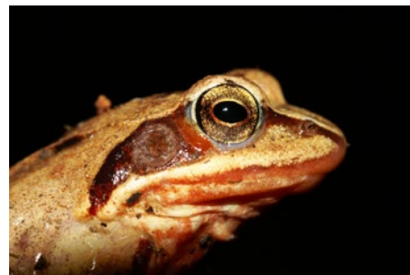
Nevladne organizacije opravljamo tudi naloge spremljanja politik, zagovorništva ohranjanja narave in bdimo nad spremembami predpisov. Opažujemo, gledamo, regljamo. Slika je simbolična – na njej plavček ( Rana arvalis ).