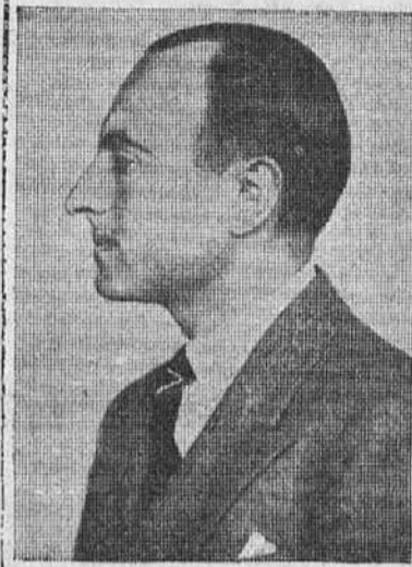
H. R. H. Prince Paul Regent of Yugoslavia

V nedeljo 5. marca bo jugoslovanska vlada uradno pozdravila Zedinjene države potom radia. Govor prihaja nekaj tednov pred otvoritvijo svetovne razstave v New Yorku, katere se udeležijo tudi Jugoslavija. Pozdravni govor v nedeljo bo imel jugoslovanski regent, princ Pavel. V Clevelandu bo oddajen program ob 1:30 popoldne potom WGAR radio postaje.