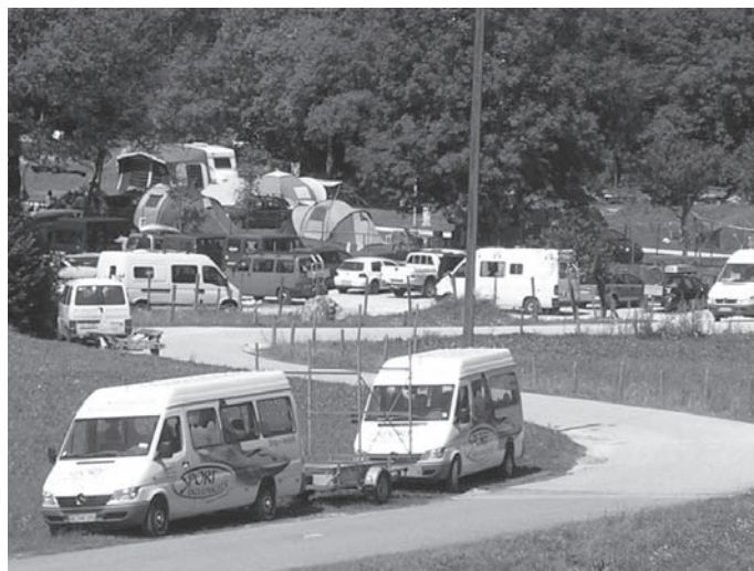
Slika 2: Prekomerna obremenitev z motoriziranim prometom v poletnih mesecih, posebej ob vikendih.

Figure 2: Overload of motor vehicles during the summer months, especially at week-ends.