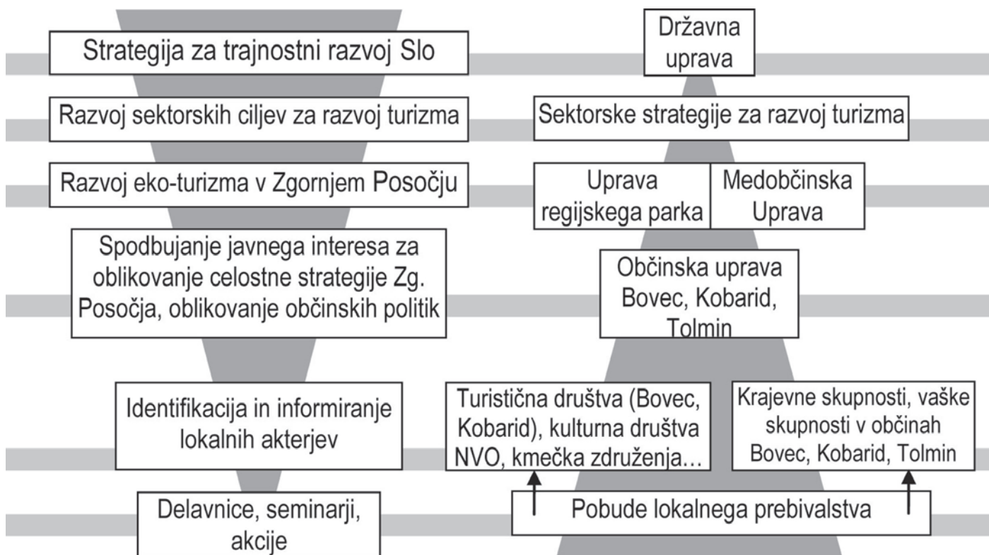
Slika 5: Preplet "top-down" in "bottom-up" pristopa pri upravljanju Zgornjega Posočja.

Omenjeni poskusi združevanja moči za razvoj Posočja so začetek in dobrodošel poskus reševanja predolgo zapostavljenih prioritet. Enotne razvojne strategije in zakonodaja "od zgoraj" lahko določajo smernice in do določene mere ščitijo pretirano izrabo prostora, vendar so v načelu daleč od lokalnega človeka. Za specifičen ožji prostor, kot je Zgornje Posočje, pa so potrebne modifikacije zakonskih okvirov in fleksibilnost pri upravljanju. Oblikovanje prilagojenih režimov in strategije razvoje zahteva lokalno angažiranost, dobro poznavanje lokalnih razmer in marljivo - z dotičnim krajem/območjem identificirano upravno garnituro. Ta na eni strani lahko omogoči sprejem posebnih odlokov, varovalnih režimov (regijski park), ki so potrebni za doseganje optimalnega razvojnega potenciala tega območja. Po drugi strani pa je lastna iniciativa lokalne javnosti, njihovih skupin in aktivnih posameznikov odločilna za razvoj strategije, uspešnost trženja, povezovanja ter razvijanja območja, skratka za dejansko udejanjanje na papirju zapisanih odlokov in strategij razvoja.