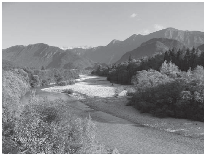
Slika 1: Reka Soča kot bistveni ambientalni element Zgornjega Posočja.

Figure 1: The Soča River as an essential ambient element of the Upper Soča River Valley.