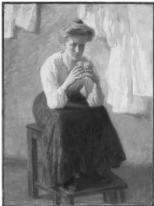
Perica s kozarcem, 1907 (Moderna galerija Zagreb;)