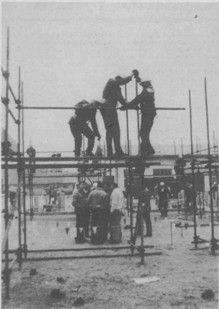
Takole so »hiteli« odrarji