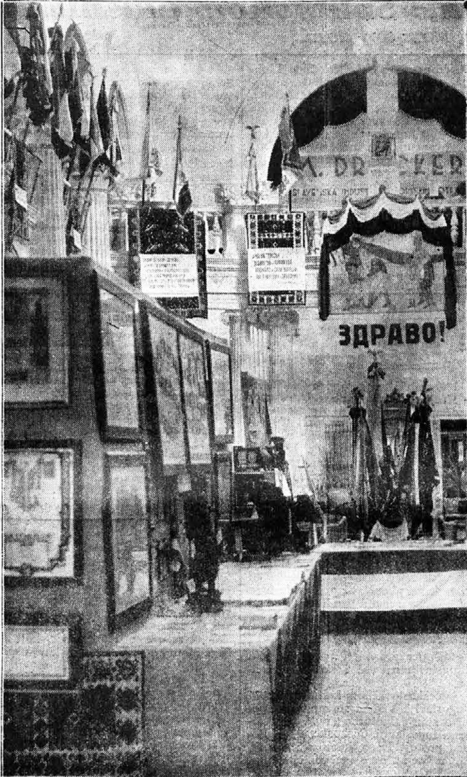
Pogled na jedan deo dvorane Oficirskog doma u Beogradu za vreme Sokolske izložbe — Desno: Pogled na deo galerije dvorane, na kojoj su se također nalazila brojna izložbena odeljenja, i koja je bila sva unakolo ukrašena zastavama sokolskih društava i čilimovima