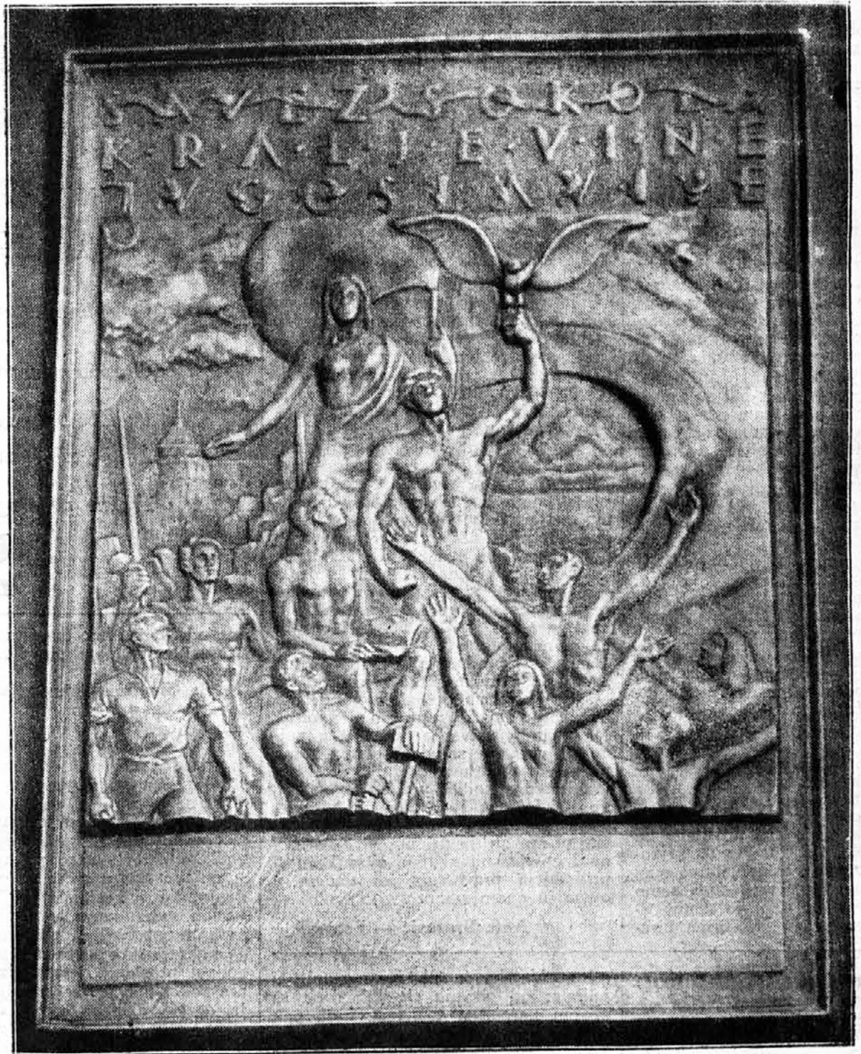
Plaketa, koju je Savez SKJ predao Nj. Vel. Kralju, prilikom svečanog otvorenja Sokolske izložbe u Beogradu 13 novembra o. g. kao svoje prvo i najviše sokolsko odlikovanje. Plaketa je rad br. Miše Švigtlja iz Ljubljane