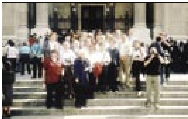
Skupina iz Novega mesta pred baziliko sv. Štefana

vidi, ka je na sliki. Našim lidam so se vidle tiste, gde so rože namalane, bregovi s plaminami, morje. Ešče en mejsce do gvüšno pri nas, tak ka če stoj šče, si še leko pogledne.