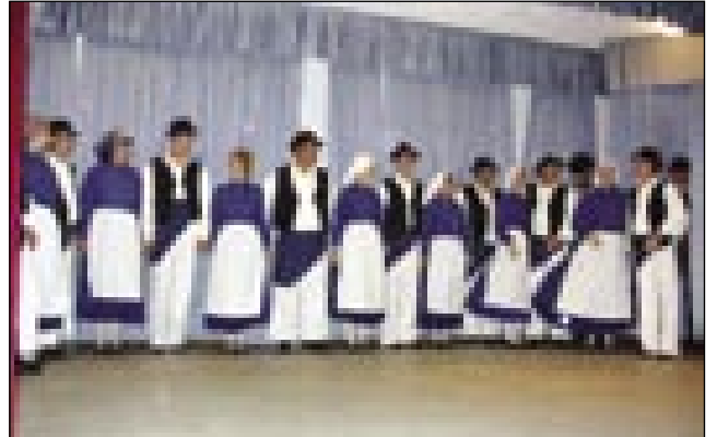
Folklorna skupina iz Sakalovec

Na začetki leta je Športno, kulturno in turistično društvo Mladost Pertoča prosilo Zvezo Slovencev, naj organizira Porabski večer za njih. Zveza je za kulturni program štiri skupine vōdeberala, štere so z veseljem vzele pozvanje.