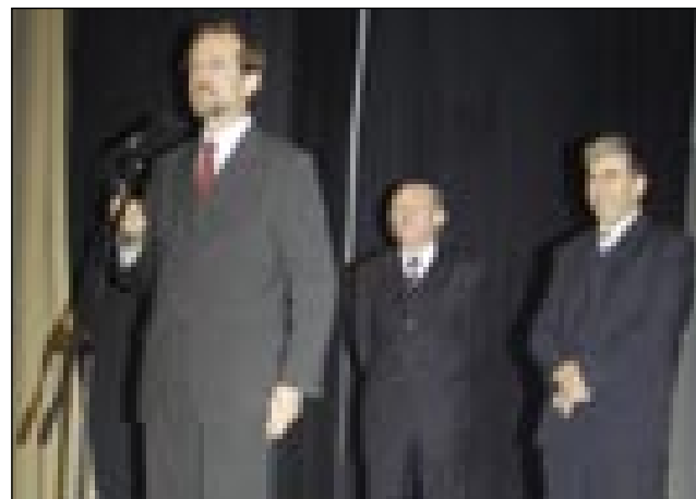
Nastopajoče in goste je pozdravil slovenski evrops poslanec Lojze Peterle