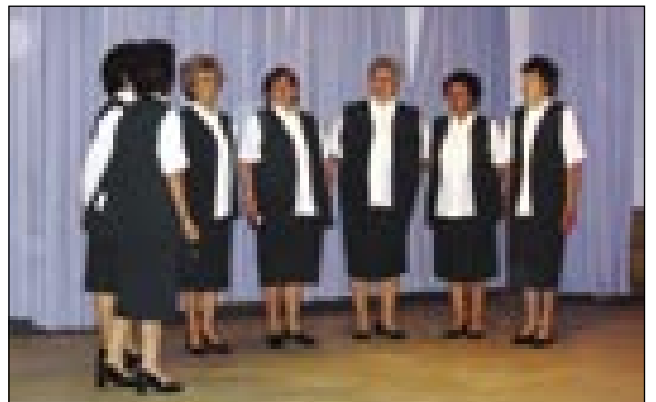
Ljudske pevke iz Števanovec

29. aprila je v Pertoči, v gasilskem domu, že skur puna dvorana čakala nji. Večer ob pau osmi vōri, gda se je program začno z mlašečo folkloro z Gorenjoga Senika, je že cejlak puna dvorana gratala. Mlajši so s svojim plesom dobro volo prinesli v dvorano. Na kulturnom programu so eške gorstaupile Ljudske pevke z Števanovec, štere so dosta taši naut spejvale, ka je publika tō poznala. Potem sta na oder staupila dva igralca z gledališke