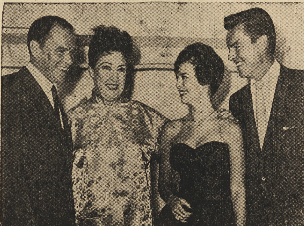
"CIGANKA" V NEW YORKU — Ethel Merman, zvezdnica glasbene komedije, je nedavno nastopila v "Ciganki" v New Yorku. Na sliki jo vidimo sredi prijateljev. Od leve proti desni: Frank Sinatra, Merman, Natalie Wood in njen soprog Robert Wagner.