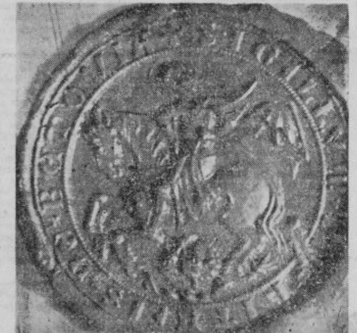
Ptujski mestni pečat z listne iz leta 1277