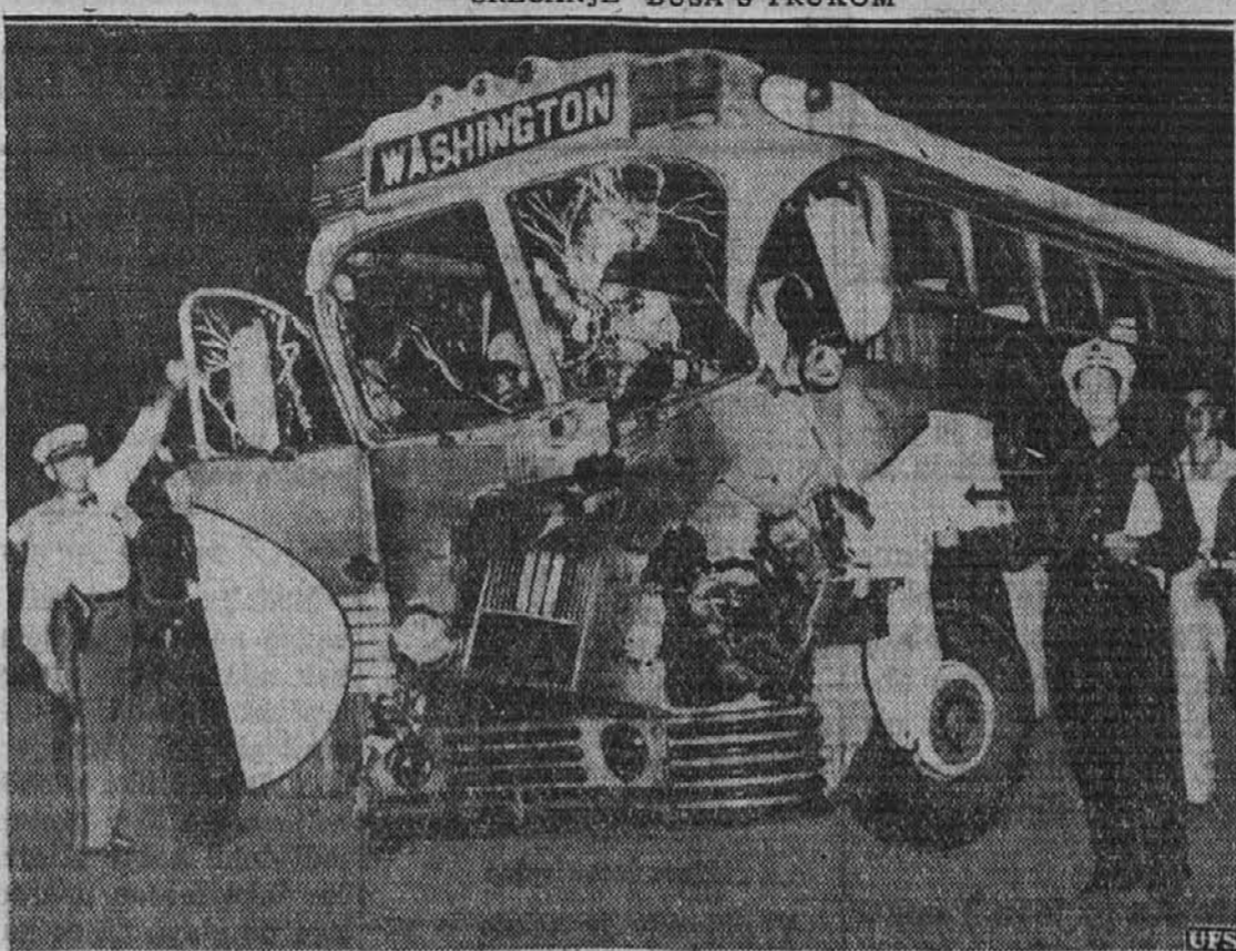
Pogled na razvaline, ki jih je povzročila kolizija med nekim potniškim busom in nekim trukom požarne brambe v bližini Philadelphije. Ranjenih je bilo pri tem 34 oseb.

Od časov, ko je živel pisatelj Jules Verne, smo slišali že toliko o potovanju na luno, da se mora človek dandanes, v dobi takšnega razvoja tehnike, že res čuditi, da se to še ni posrečilo doseči. Sicer so v New Yorku že ustanovili Družbo za raziskavanje lune, ki je njen predsednik že dal 20.000 dolarjev za svoj lastni pogreb na luno, a če bo kdaj ta pot uspela, pa vendar še nič ne vemo. Dasi se nam 384 tisoč kilometrov dolga razdalja od zemlje do lune ne zdi nič pre-