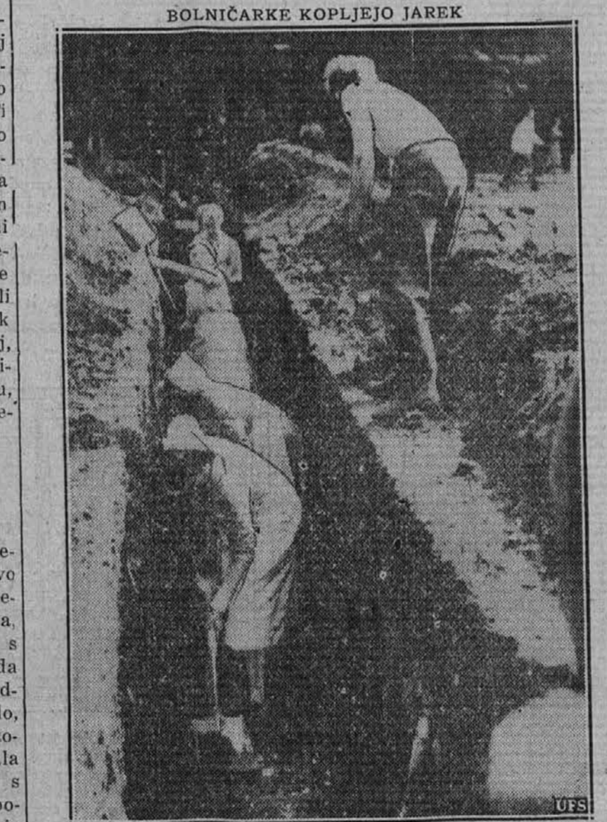
Zadnje dni pred izbruhom vojne je moralo iti v Londonu vse na delo, da se preskrbi mesto s potrebnimi zatočišči pred bombami. Gornja slika kaže bolničarke, ko na dvorišču neke bolnice kopljejo jarek v to svrhu.

Regulacijska dela Hudega potoka in ceste z Rečice na Veliki vrh in proti St. Andražu pri Šmartnem ob Paki, tako poročajo iz Celja, so pripomogla, da so odstranjene vse nevarnosti novih poplav, katere je ob večjih nalivih vprizarjal Hudi potok.