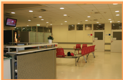
Recepcija Oddelka za teleradioterapijo