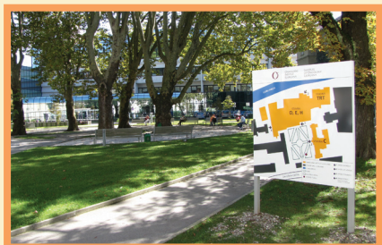
Park pred stavbami Onkološkega inštituta