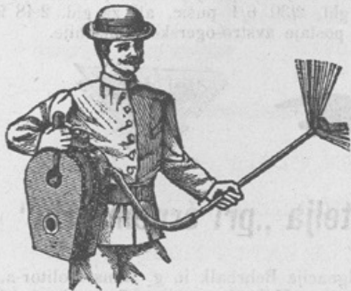
Zastopniki se iščejo!

Trijerji (čistilni stroji za žito) v natančni izvršitvi. Sušilnice za sadje in zelenjavo, škropilnice proti peronospori. Zboljšani sestav Vermorelov. Mehovi za žvepljanje trt. Mlatilnice , mlini za žito, stiskalnice (preše) za vino in sadje različnih sestav. Slamoreznice jako lahke za goniti in po zelo zmernih cenah. Stiskalnice za seno in slamo, ter vse potrebne, vsakovrstne poljedeljske stroje, prodaja v najboljši izvršitvi