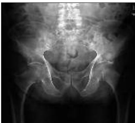
Slika 3. Osteolitična lezija na prehodu v sramnico desno z grozečim patološkim zlomom 84-letnega bolnika z rakom pljuč.

mera kostne skorje in v primeru, ko se zasevek nahaja na nesubtrohanterem področju (2). Za kirurgijo se odločimo na osnovi splošnega stanja bolnika in njegove pričakovane življenjske dobe, vrste malignoma ter njegove razširjenosti v kosti in druge organe. Posebno oskrbo potrebujejo tudi zasevki v vretencih, saj za bolnika pogosto predstavljajo hudo funkcionalno motnjo (slika 2). Približno 70 % vseh hrbtničnih zasevkov najdemo v prsni hrbtnici, 20 % v ledveni in 10 % v vratni ter križni hrbtnici (2). V primeru kompresije hrbtnjače zaradi zasevkov v vretencih je nujno takojšnje ukrepanje. Gre namreč za urgentno stanje, ki sicer ne ogroža bolnikovega življenja, vendar neustrezno ukrepanje vodi do nepopravljivih okvar živčevja in posledično ohromitev (plegijo) bolnika od prizadetelega segmenta navzdol. Prvi znak kompresije hrbtnjače je bolečina, ki jo pogosto spregledamo. Kasneje se pojavijo parestezije in nevrološki izpadi v smislu motenj sensorike, motorike ali sfinkterskih motenj. Nevrološkemu pregledu, kjer določimo tudi nivo kompresije, sledi takojšnja MRI-preiskava in predstavitev kirurgu za načrtovano dekompresijo. V vmesnem času mora bolnik mirovati in prejeti antiedemsko terapijo s kortikosteroidi. Kirurško zdravljenje