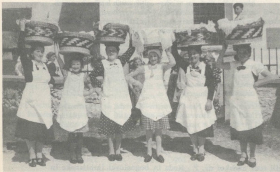
DOBROVSKA DEKLETA NA VELIKO SOBOTO NESEJO K ŽEGNU: Kolač, spomin Kristusove traveje krone, pet rudečih pirhov, Jezusove rane in kri, tri korenine hrena, žebelje s katerimi so Kristusa pribili na križ, gajat, jagenčka - samega Jezusa, ki je bil za nas križan.