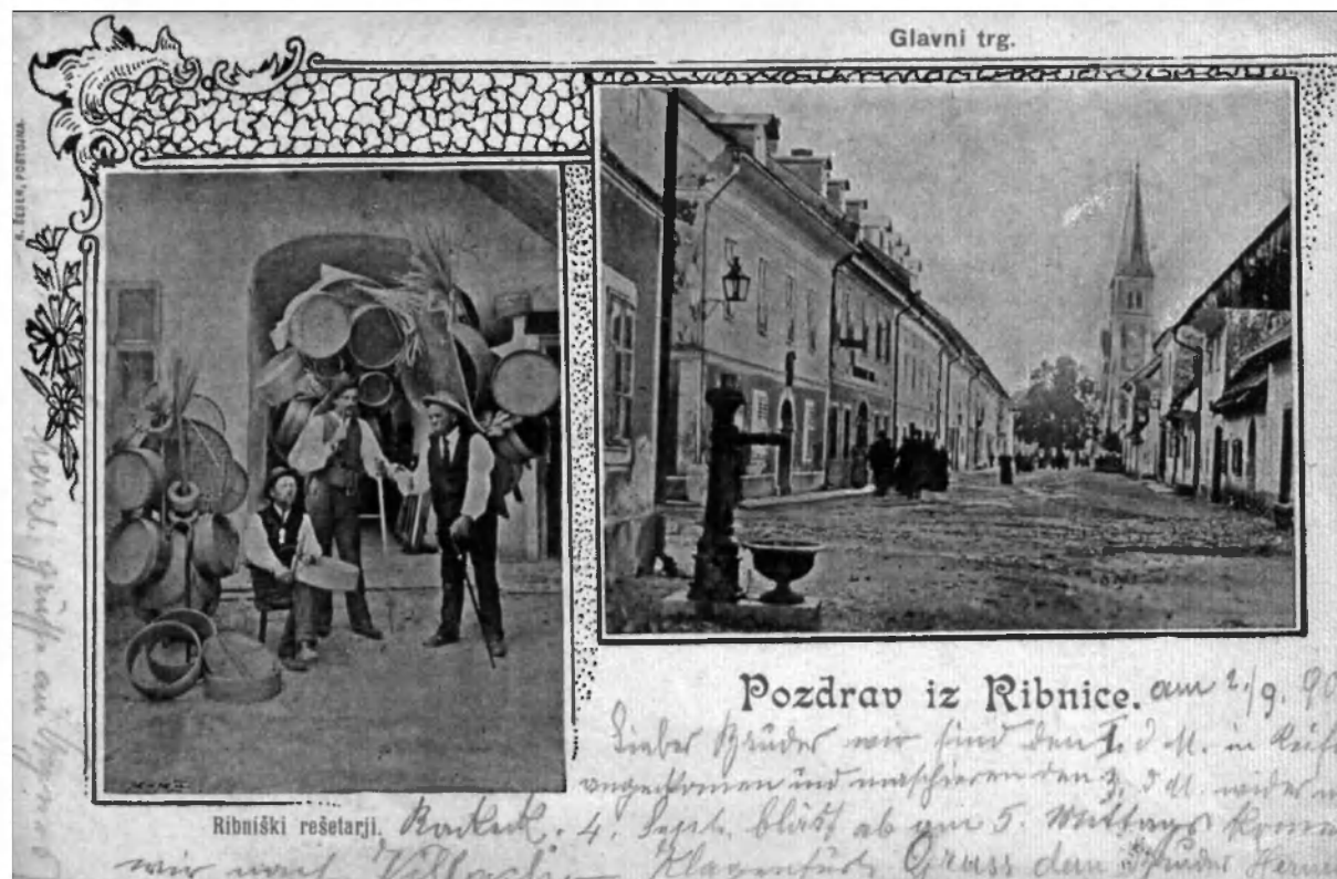
Razglednica Ribnice, leto 1900.