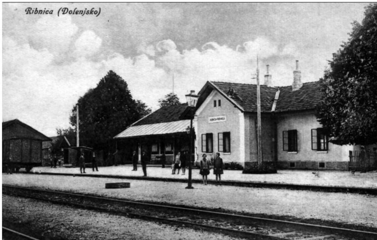
Železniška postaja v Ribnici. Fotografirano po letu 1920.

redno ljudsko šolo. Marsikdo je svoje šolanje nadaljeval tudi v Ljubljani, ki je bila dokaj blizu.