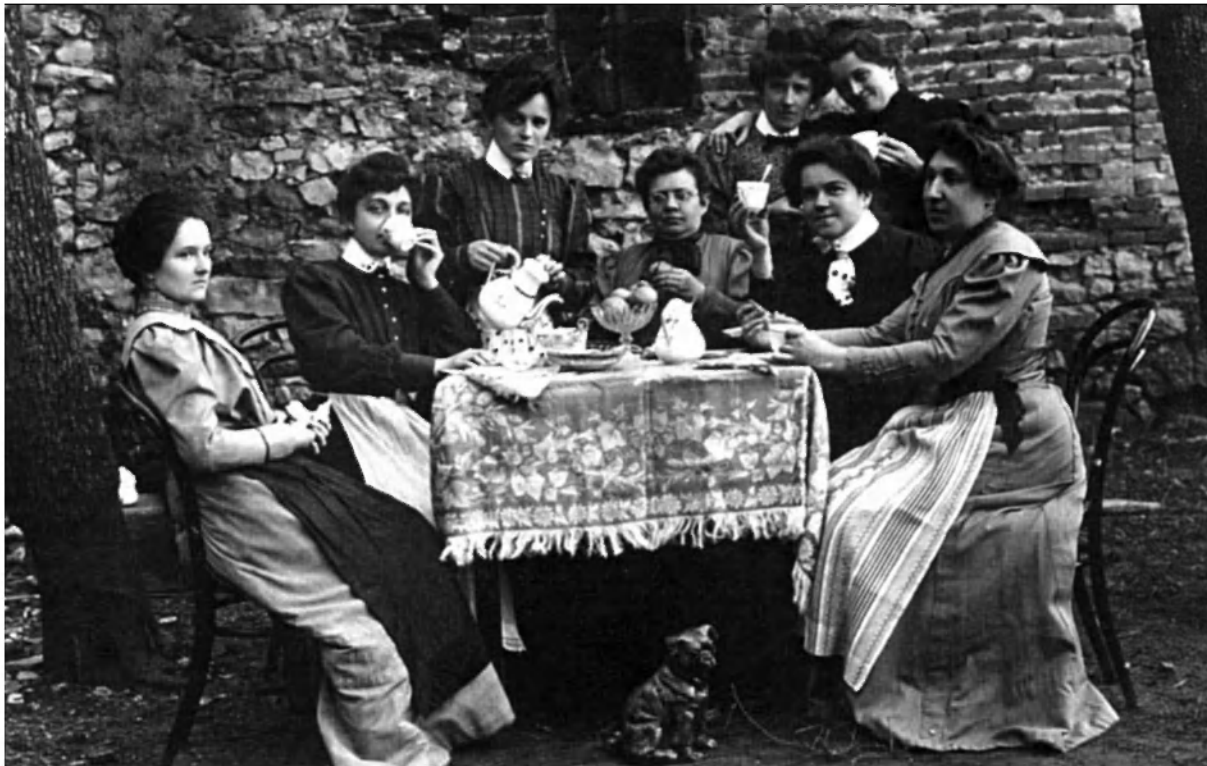
Trške gospe ob čaju.

cial, babica, dimnikar, žagar, župnik v pokoju, občinski tajnik, pismonoša, šivilja, trgovec z vinom, krojač, urar idr. V Ribnici je bilo 97 najemnikov, neupoštevajoč njihove družinske člane.