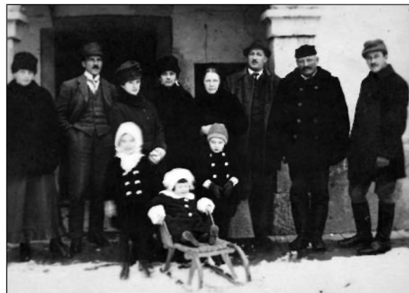
Ribniški veljaki pred Cenetovo gostilno.

čevljarji (3), klobučar (1), tesarji (3), mizar (1), mlinar (1) in gostilničar (1). 34 V trgu so prebivali domačini, katerih družine so že dolgo prebivale tu, delavci (dninarji, dekle, hlapci, služkinje) in uradniki, ki so v Ribnico prišli opravljat službo od drugod. Nekateri od teh so tu tudi ostali.