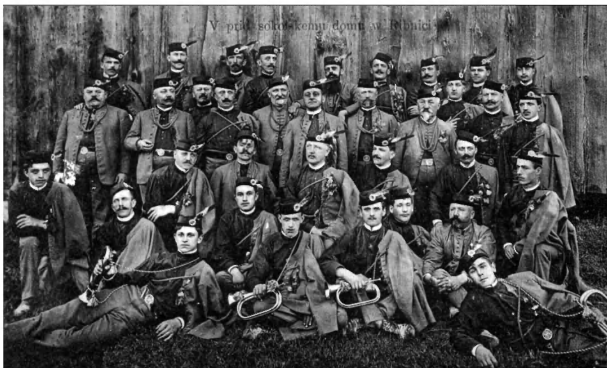
Ribniški sokoli na izletu v Velikih Laščah leta 1908.