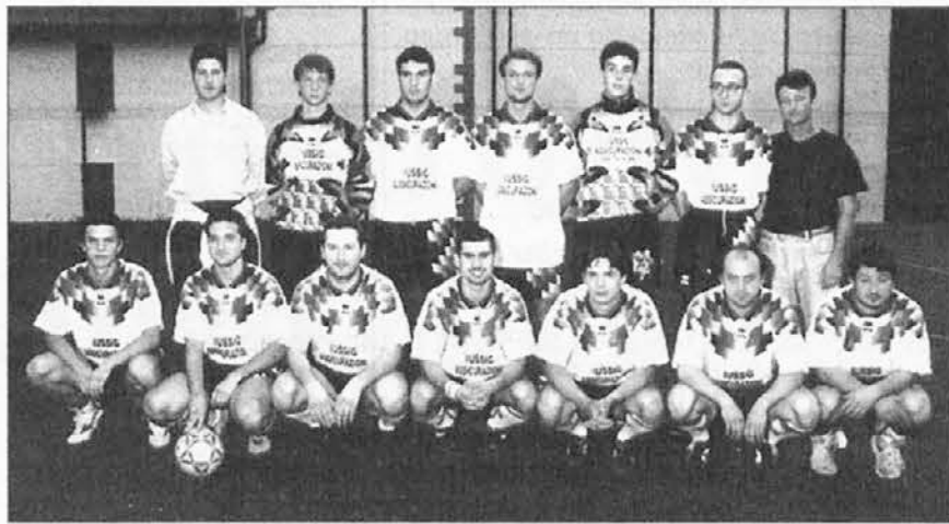
La Iussig Assicurazioni impegnata nel girone A del torneo di Liessa

Nell'ultimo girone, nonostante la presenza in campo di Pierino Fanna, la Rosticceria Susanna ha dovuto in-