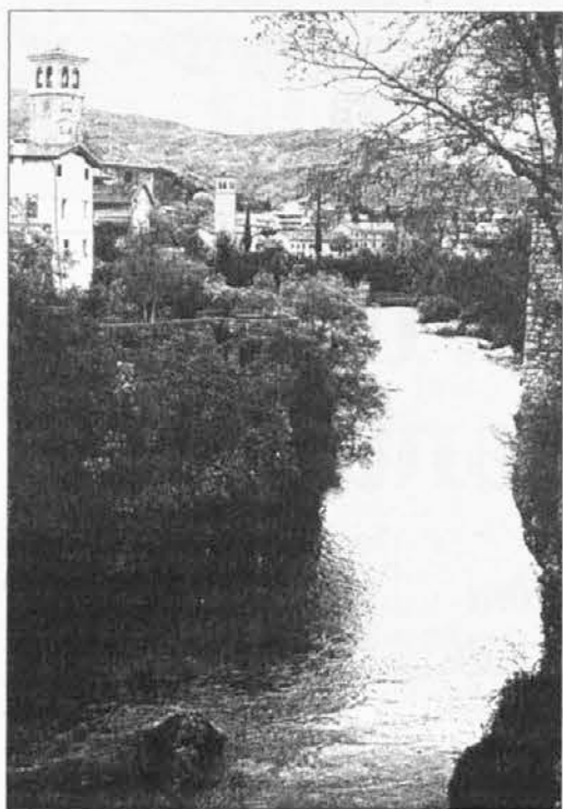
Il corso del Natisone scavato nei conglomerati rocciosi a Cividale

Al rialzo della temperatura corrispose dunque la fusione delle masse glaciali e ciò provocò una gigantesca torrentizzazione delle valli montane, produsse solchi profondi negli ammassamenti morenici, prodotti dalla spinta dei ghiac-