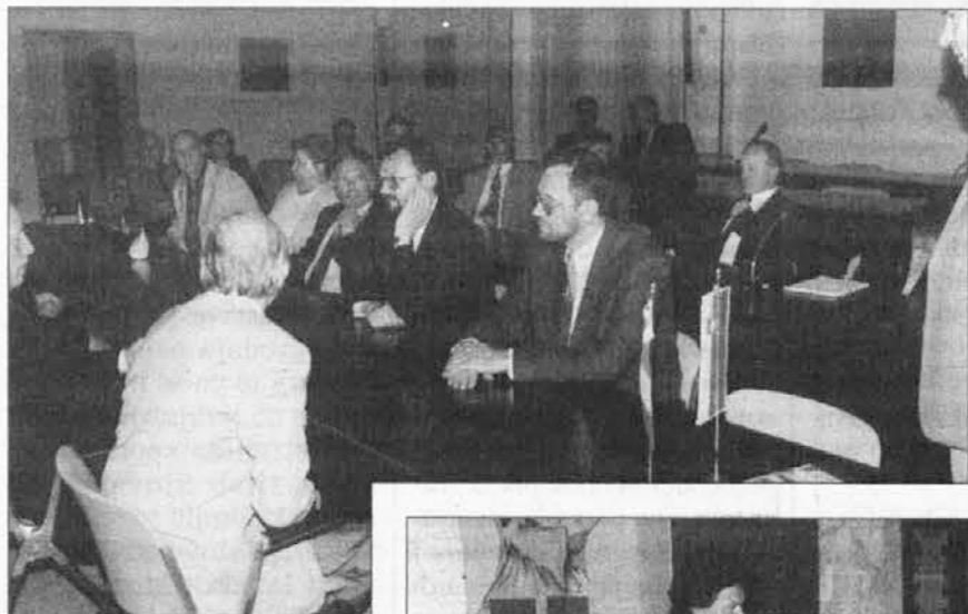
Slovenski poslanci na obisku v Spetru

Brez olepsavanja so predstavili dramatično sliko slovenske manjšine v Benečiji, kakršna izhaja že iz samega podatka, da če se je pred 45. leti rodilo v nadiskih dolinah 515 otrok, se jih je predlanskim rodilo desetkrat manj, le 56. Torej gre za skupnost, ki je življensko