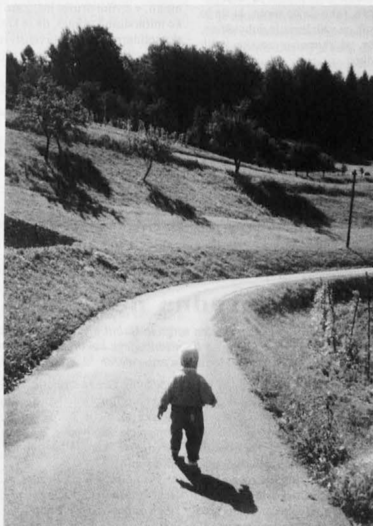
Njegova življenjska pot je še dolga...

Ker je v torek, 1. novembra, praznik ob dnevu vseh svetih, prosimo sodelavce in druge bralce Katoliškega glasa, naj pošljejo članke, prispevke in obvestila najkasneje do ponedeljka, 31. oktobra, ob 13. uri.