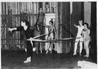
20. oktobra je Združenje slovenskih športnih društev v Italiji praznovalo 70-letnico ustanovitve svojega predhodnika Športnega združenja