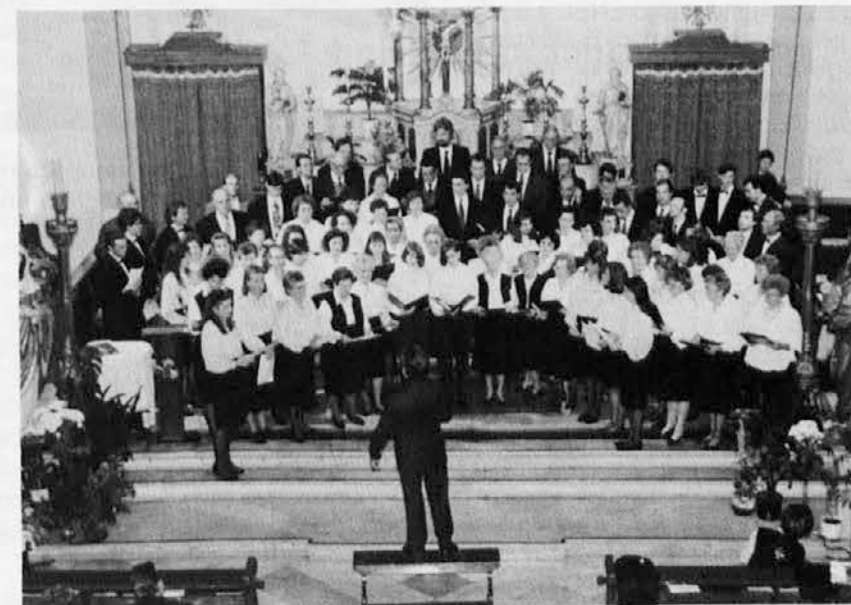
Slavnostni večer v Škednju je zaključil zbor združenih pevcev (foto Kroma)

Večer je potekel v toplem in prijetnem vzdušju, in se je končal v prijateljskem srečanju v Domu, kjer so si gostje in domačini ogledali ikono-grafsko razstavo.