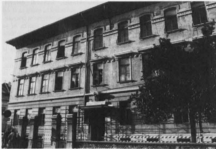
Sedanji sedež nižje srednje šole Ivan Trinko v ul. Cappuccini 10

Nižja srednja šola Ivan Trinko bo morala zaradi slabega stanja stavbe, v kateri je sedaj, v druge prostore. Za šolo bo to ponovna selitev, potem ko je morala iz stare stavbe v ulici Randaccio v bivše semenišče in od tam v sedanjo stavbo. Ta po svoji velikosti in lokaciji dobro odgovarja zahtevam naše nižje srednje šole. Ker pa zaradi dotrajnosti električne napeljave ne daje dovolj jamstev za varnost, je občinska uprava sklenila, da premesti šolo. Pri tem je treba poudariti, da od vseh šol v Gorici samo nekatere (med njimi novi slovenski šolski center) odgovarjajo vsem novim predpisom.