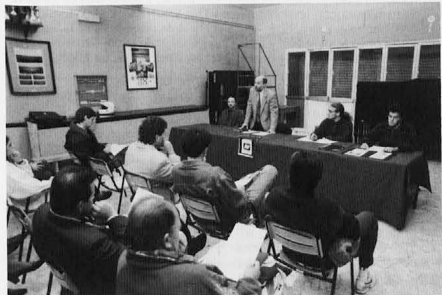
Posnetek s tiskovne konference