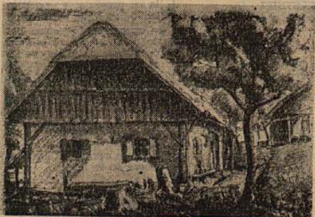
Viktor Povše: DOLENJSKI MOTIV (1961)

Preprečujmo nesreče z redom in delovno disciplino!