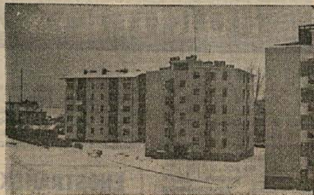
Med črnomaljskimi stolpnici pozimi

Ob taki aktivizaciji pa bo dovolj priložnosti za poglo-