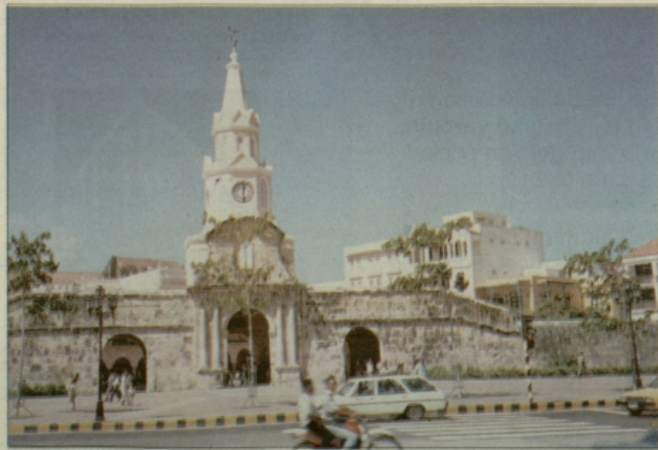
Zvonik v starem delu Cartagene.

AKCIJA 1=2 PLAČA EDEN - POTUJETA DVA (cena za 2 osebi) KORČULA 9. - 17.6. / LADJA + AVION + 7 x POLP / 58.900 SIT + takse CAVTAT 16. - 24.6. / LADJA + AVION + 7 x NZ / 59.900 SIT + takse ŠIPAN 16. - 28.6. / LADJA + AVION + 11 x POLP / 79.900 SIT + takse