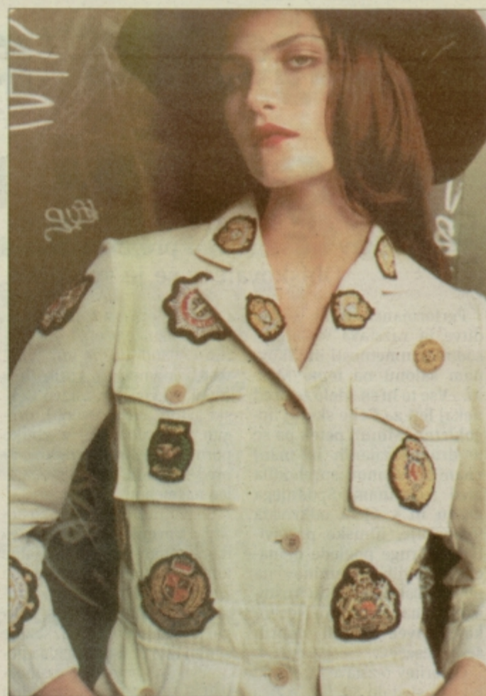
Altra moda ali kako star safari jopič spremeniti v novomodno oblačilo.