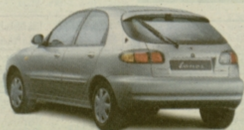
Lanos s klimo že od 15.990 DEM ali 1.774.890 SIT*