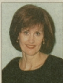
Piše: MAJDA KLANŠEK

izdobljemo z žličko. Pazimo, da ostane lupina nepoškodovana. Na maslu ali margarini prepražimo drobno sesekljano čebulo in mletu meso. Dodamo začimbe in dišave, sesekljano jušno kocko in paradižnikovo mezgo. Prepražimo, zalijemo z malo juhe in prevremo. Meso zmešamo z izdobljenim in seseklanim mesom jajčevcev. Zmes naložimo v jajčevce. Potresemo s sirom in obložimo s koščki masla. Pečemo v vroči pečici pri 250 stopinjah 2 do 3 minute. Zmešamo kis, paradižnikovo mez-