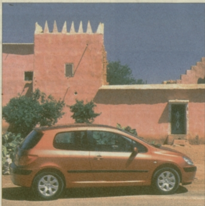
Peugeot 307 odslej tudi na slovenskih cestah.

Peugeot 307 ima običajno zasnovano, se pravi motor spremljaj, pogon prav tako. Zuna-