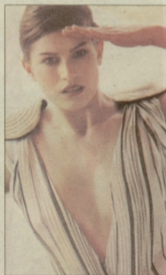
Razumem! Epolette so dovolj za trendovski videz.

Na modnem področju, kajpada...Vendar, če si »natočimo čistega vina« - vojaške hlače izgledajo na moškem čisto nekaj drugega kot na brhki mla-