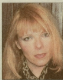
Pripravila: VLASTA ČAH-ŽEROVNIK

V času hladne vojne so revolucionarni in ostali režimi vojaški stil izpopolnili in raznesli po vsem svetu. Ko smo si nato še ogledali nekaj mačističnih hollywoodskih akcionarjev v olivno zelenih srajcah in vojaških čepicah, se je trendovski plaz zares sprožil. Moški so z vojaškim stilom oblačenja postali še bolj možati, za ženske pa je napočil čas, ko lahko svoj skozi tisočletja zatirani ego končno