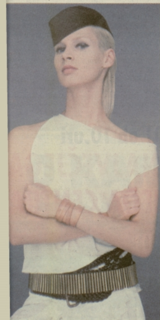
Deviška belina z vojaško sivino.