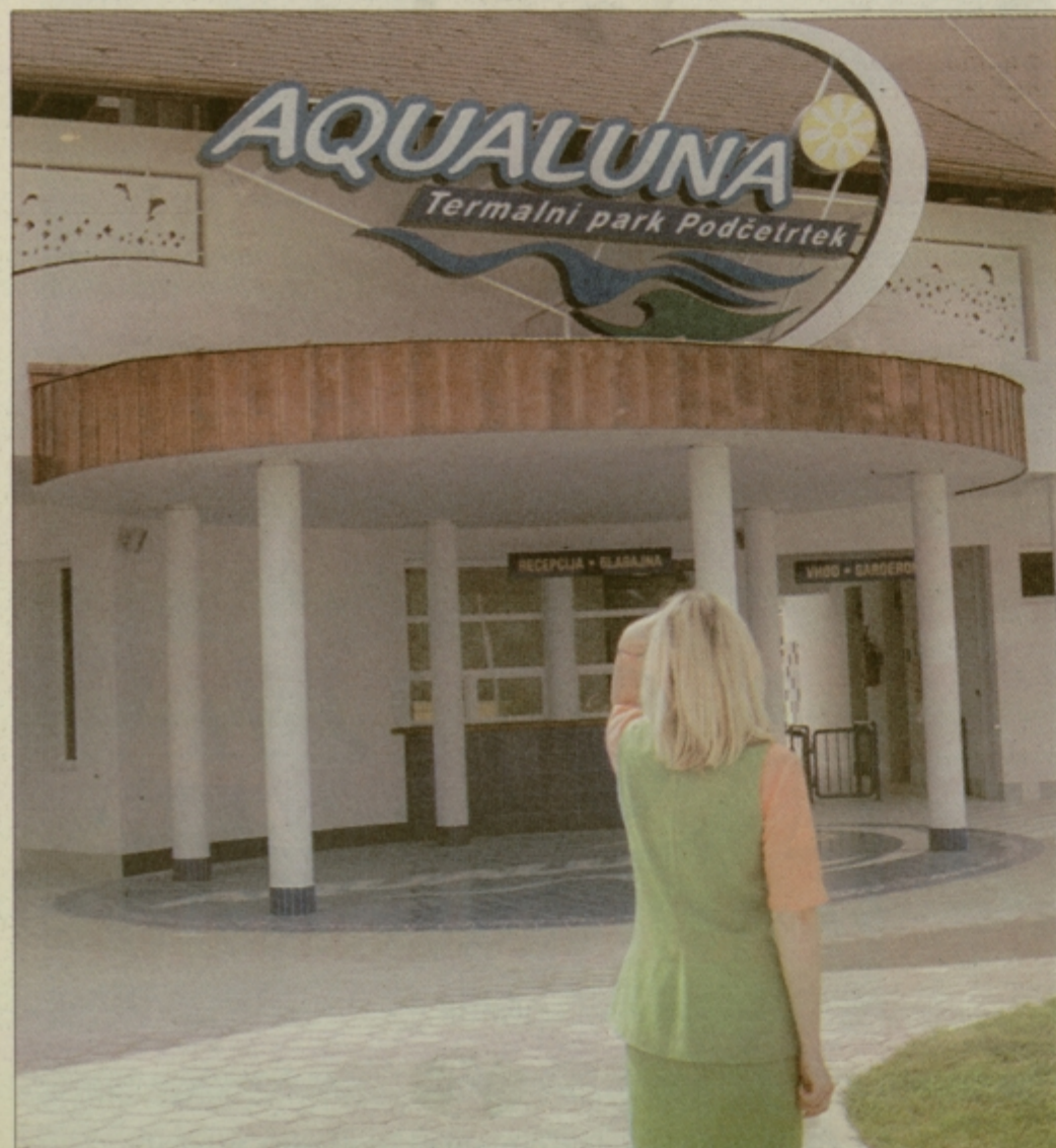
Aqualuna, Termalni park Podčetrtek pričakuje prve obiskovalce, ki bodo zaplesali vodni ples.