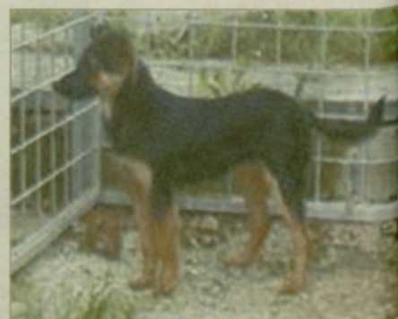
V Vojniku so 22. maja našli sedemmesečno križanko.

Več informacij o izgubljenih živalih dobite v zavetišču za male živali Zonzani v Jarmovcu pri Dramljah na telefonu 749-06-02 in na spletni strani http://corne.to/zonzani . Odpiralni čas za ogled psov je ob delavnikih od 12. do 16. ure.