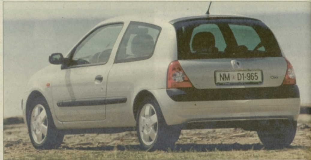
Prenovljeni clio spredaj in zadaj.

V osnovni izvedenki bo avto opremljen s po štirimi zračnimi varnostnimi blazinami (dve prednji s programiranim napihovanjem), protiblokirnim zavornim sistemom ABS z elek-