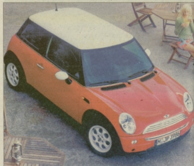
Novi mini bo prodajna uspešnica.

Tovarna je v naročju nemškega BMW, vendar bodo miniji naprodaj v ločeni mreži in bodo morali imeti trgovci zanje posebne prostore - vsaj tako naj bi bilo. Novi mini se od svojega predhodnika bistveno razlikuje, kajti daljši je za več kot 50 centimetrov (362 centimetrov), seveda pa je hkrati tudi nekaj višji in z večjo medosno razdaljo (246 centimetrov). Navzven avto povzema podobo nekdanjega minija, že na prvi pogled pa je očitno, da bo doživel številne dodelave. Notranjost je seveda daleč od špartanskosti, znane iz prejšnjega minija. Tistim pa, ki bodo hoteli in zmogli seči nekaj globlje v žep, bodo recimo ponudili tudi usnjene sedeže ipd. Zanimivo je, da bo ob ročnem