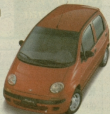
Matiz s klimo že od 11.990 DEM ali 1.330.890 SIT*