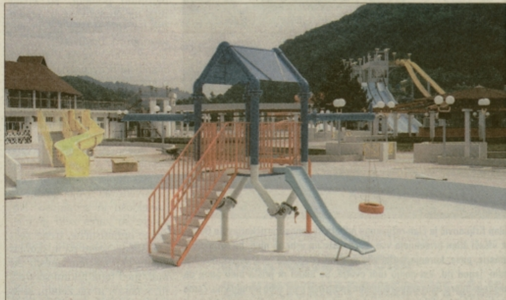
Otroška domišljija je neizmerna, zato so v Termalnem parku poskrbeli tudi za najmlajše, ki bodo lahko izbirali med vožnjo po toboganih, obiskom pravljničnega gradu ali igro v otroških bazenčkih.