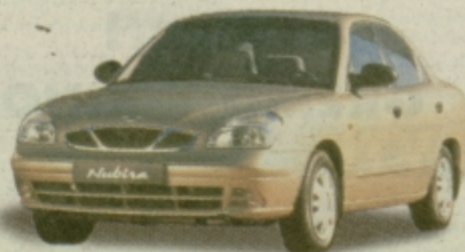
Nubira s klimo že od 19.990 DEM ali 2.218.890 SIT*

Ponudba velja za vozila letnika 2000, pri izbranih v svojih razredih pa boste glede na ceno gotovo dobili največ opreme.