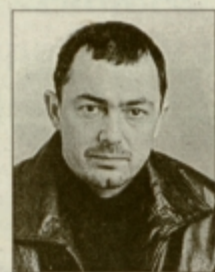
Piše: TADEJ ČATER

In kdo bi si mislil, da so lahko tudi televizijske oddaje, radijski programi in časopisi, revije, neke vrste igrače. Tako za otroke kot za odrasle. Neki mullec, ki je dopolnil osemnajst let, me je povabil na svojo rojstnodnevno zabavo, hmmm, neke vrste daljna zlahta, je kot darilo prejel tudi električni brivnik. Tistega za striženje brade. Za urejanje brade. Igračo. Ki se jo je razveselil tudi njegov oče. Jasno; tokrat si bo lahko za spremembo prvič po osemnajstih letih oče nekaj sposodil od sina. Pri čemer je bila zanimiva njuna reakcija; medtem ko je oče v brivniku oziroma urejevalniku brade videl predvsem praktično vlogo, je sin ta isti brivnik uzrl kot simbol. Kot simbol moškosti. Kot simbol odraslosti. Dozorevanja. Identifikacije z odraslim oziroma boljše povedano, z moškim svetom. Njegov dedek, ki je bil prav tako prisoten, ki je ves čas nekaj klobasal o raznoraznih avtomobilih in svojih nekdanjih podvigih, pa se je najbolj razveselil nečesa drugega. Prav tako darila. Oziroma so se ga ta-