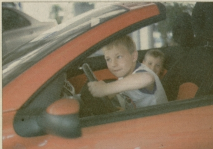
Najmlajši so želeli »vaditi« za kasnejše resne vožnje.

Slika je simbolična. Daewoo Motor, Slogre 33, 1000 Ljubljana, www.daewoo-motor.si