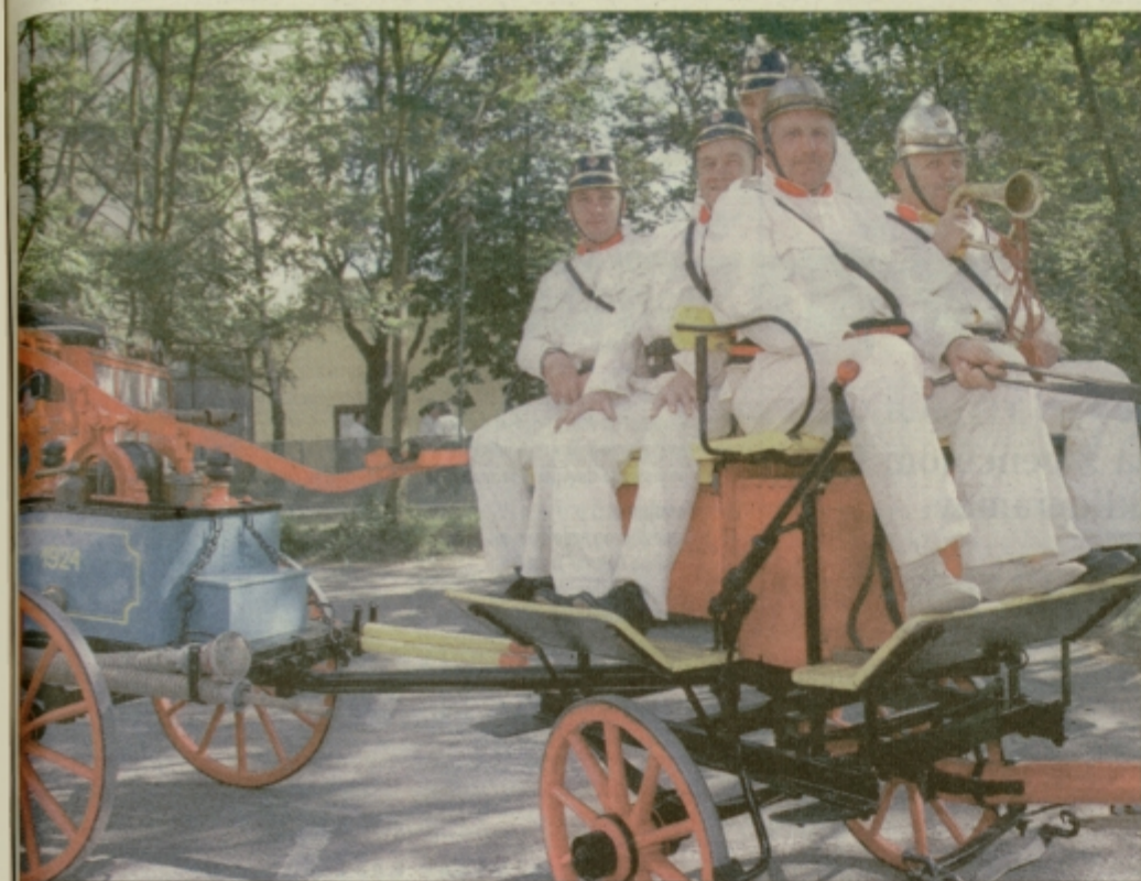
V drugem delu parade so prikazali gasilsko tehniko od prvih začetkov do naj sodobnejših vozil in ostale opreme. Na sliki gasilci iz Trnovelj pri Celju z ročno brizgalno iz leta 1924.