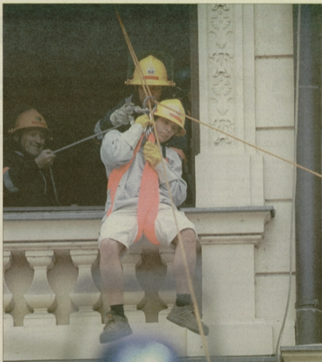
V veliki vaji reševanja iz Narodnega doma so ob gasilcih sodelovali reševalna zdravstvena služba, policija in helikopterja Hudournika z gašenjem iz zraka in prevozom ponesrečenca v Ljubljano. Med mnogimi načini reševanja iz višjih nadstropij je bilo tudi reševanje z vrvo »italijanček«.