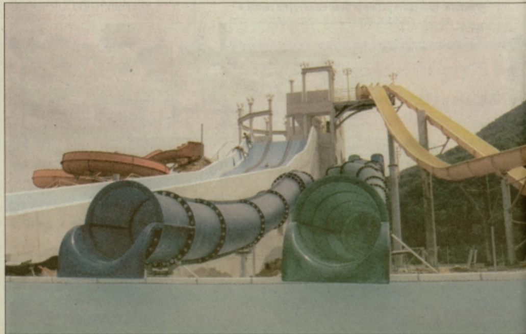
»Vodna drča«, »spiralna pletenica«, »boa vodna steza«, »drop steza« ter »kamikaze steze« so pripravljene na sobotno otvoritev, ko jih bodo preizkusili najpogumnejši.