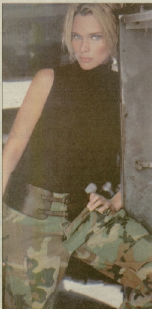
Ko se stroge vojaške hlače prelevijo v zapeljivo oblačilo...

denki. On je v njih videti avtoritativen junak, ona pa še bolj poželenja vredna... Drži?