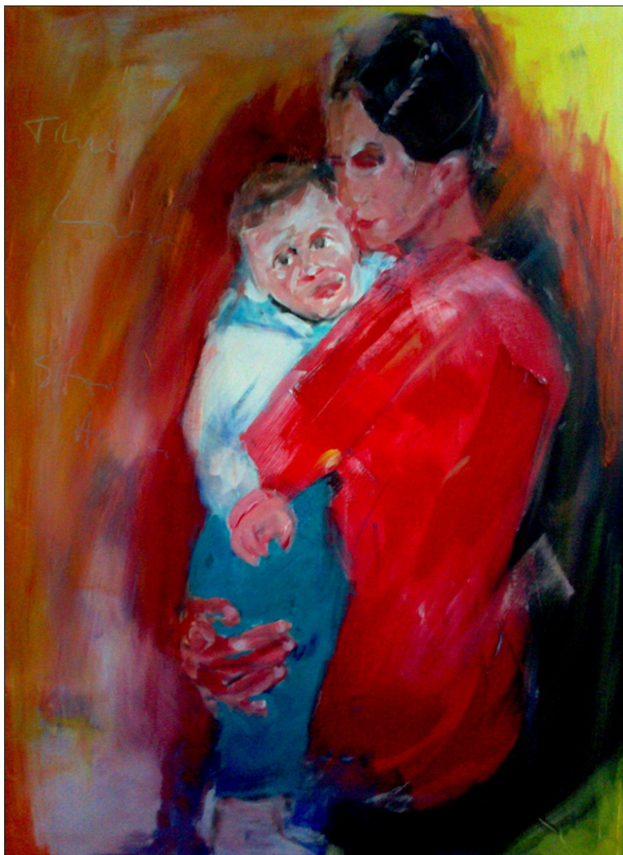
PRAVA LJUBEZEN AKRIL NA PLATNU, 70X100 CM