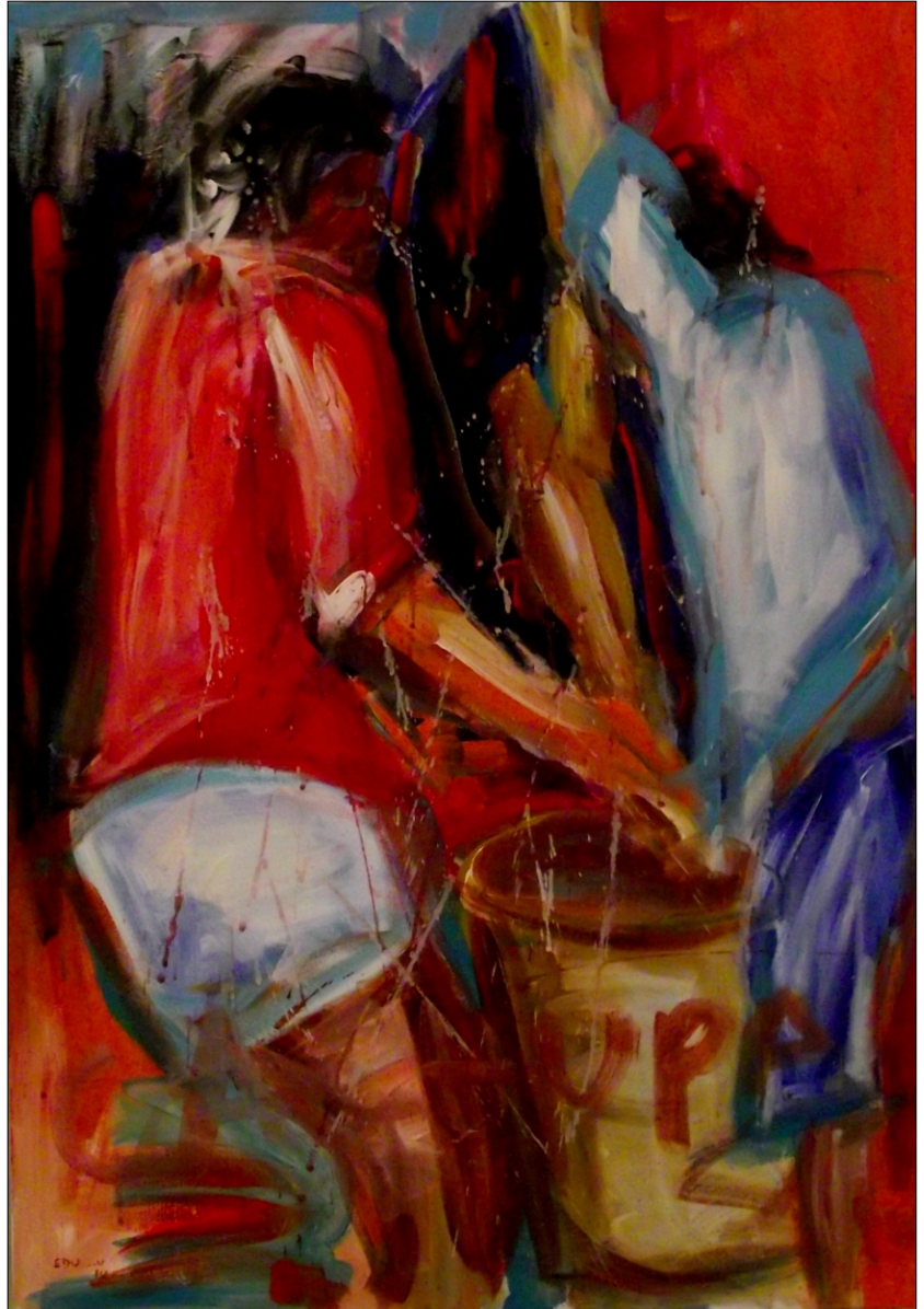
PRED OBROKOM »CATCHUPA« AKRIL NA PLATNU, 70X100 CM