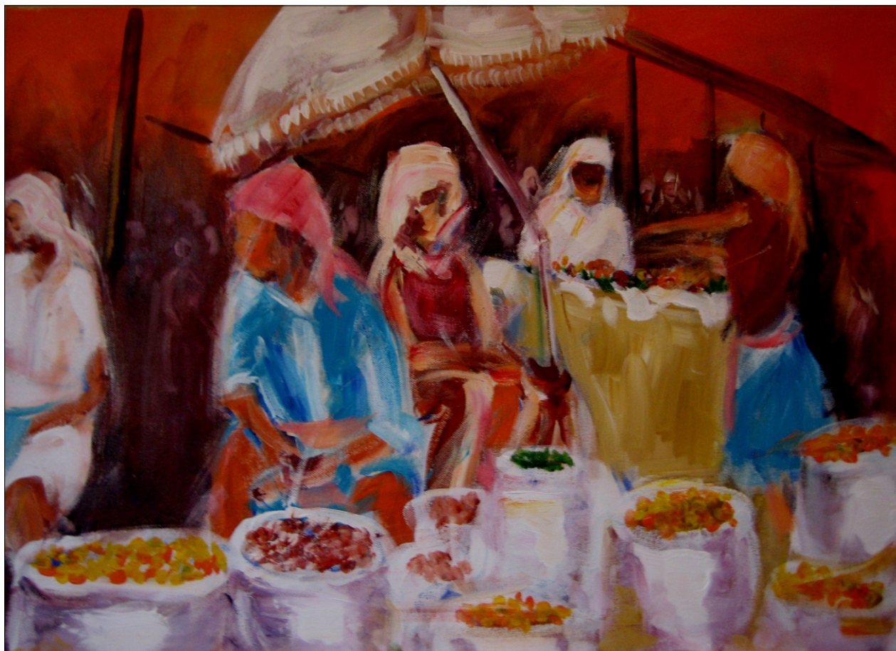
TRŽNICA AKRIL NA PLATNU 70X50 CM