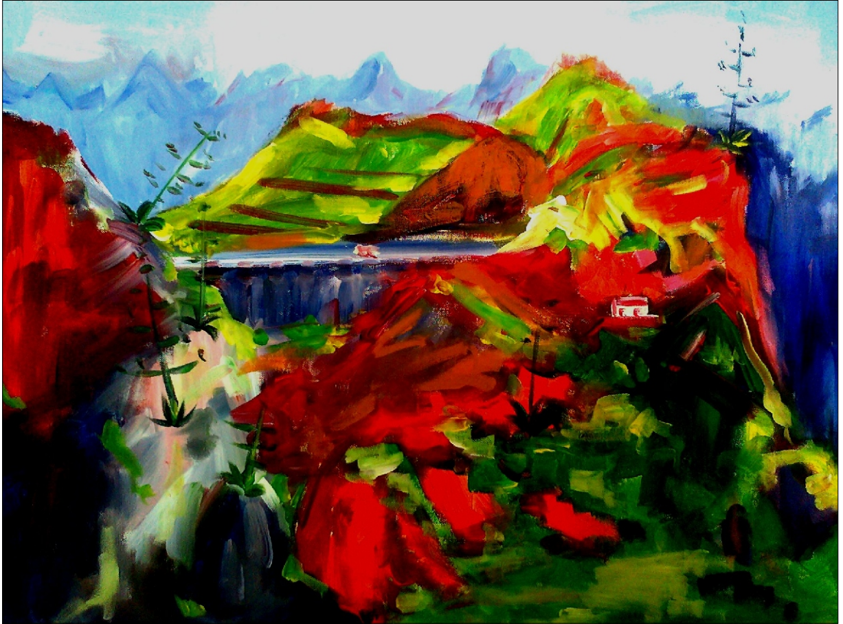
BARVE MOJEGA OTOKA AKRIL NA PLATNU, 80x60CM