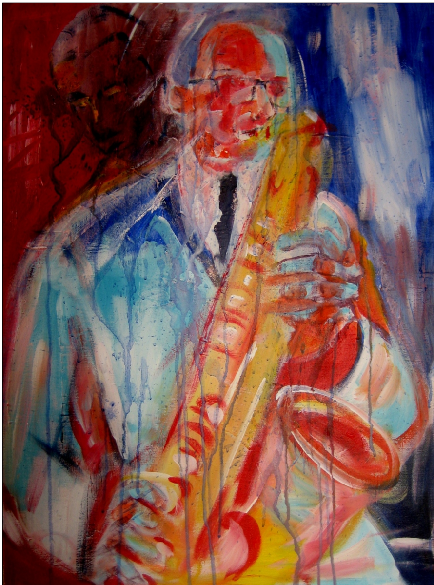
GLASBA IN BARVE 3 AKRIL NA PLATNU, 60x80 CM