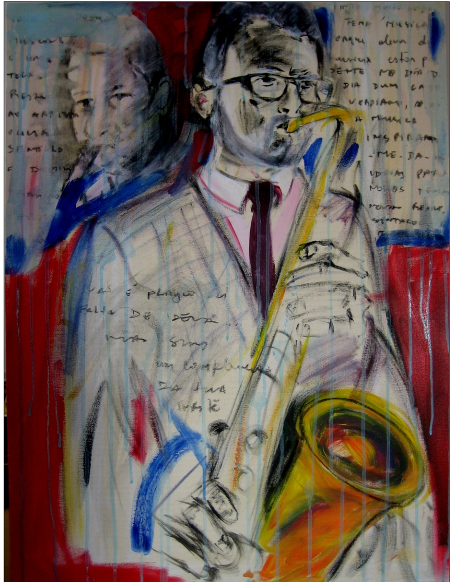
GLASBA IN BARVE 1 AKRIL NA PLATNU, 80x60 CM