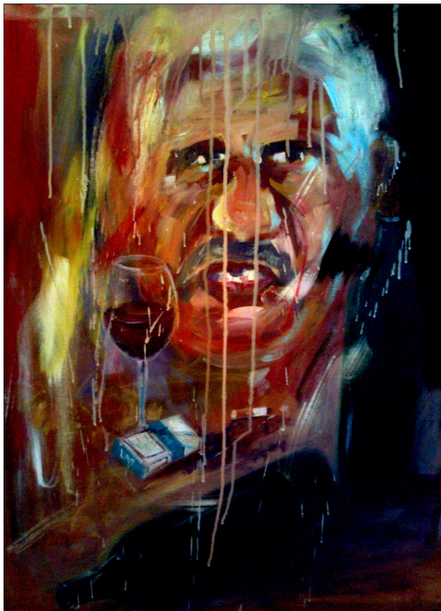
VIVA AKRIL NA PLATNU 60x80 CM