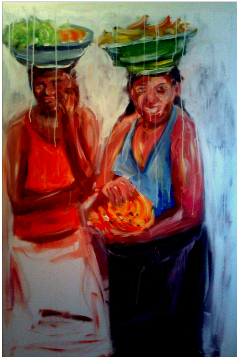
DOMAČINKI S SADJEM AKRIL NA PLATNU, 80X120 CM