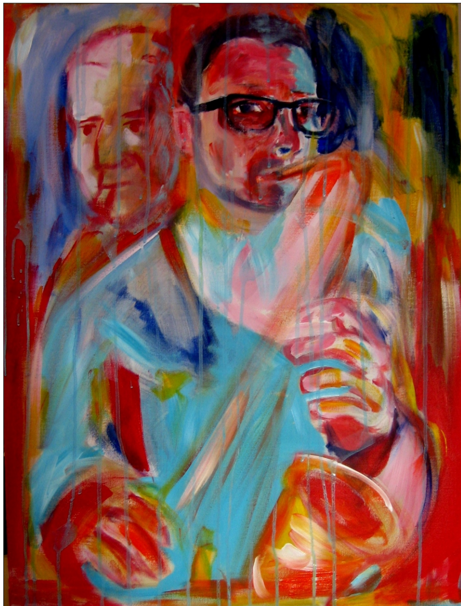
GLASBA IN BARVE 2 AKRIL NA PLATNU, 60x80 CM