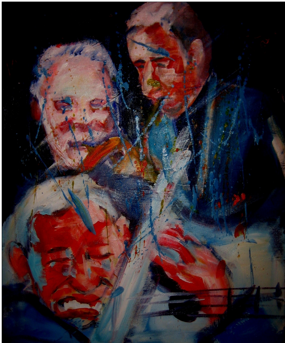
JAZZ AKRIL NA PLATNU, 60x80 CM