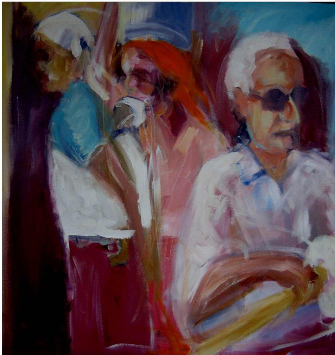
VSADAN NA ZELENORTSKIH OTOKIH AKRIL NA PLATNU, 60x80 CM