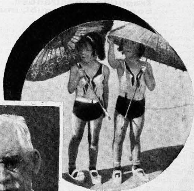
Zdaj sta si še popolnoma slični. Morda pa bo ta sličnost z leti prešla? Narobe!

da imata „neprava“ dvojčka ravno podedovane lastnosti drugačne: najbolje se to vidi pri telesni konstituciji (telovadbi) in pri posebni nadarjenosti (risanju). Pri „nepravih“ dvojčkih je bilo trikrat več takih primerov kakor pri „pravih“, ko je samo eden izmed obeh dvojčkov izdelal razred, drugi pa obsedel.