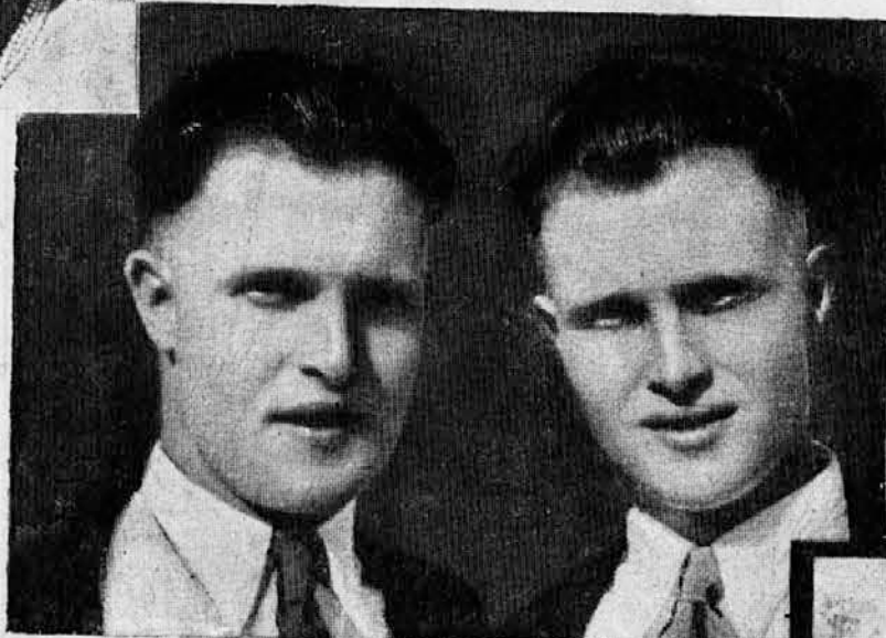
Tale dva bi bila skoraj prišla v ječo, ker sta za šalo zamenjala svoji nevesti. Siroti potem nista vedeli, kateri je pravi...

Rekli smo, da sta homologna dvojčka že na zunaj drug drugemu nenavadno podobna. Opazili so, da gre sličnost tako daleč, da se celo črte na njihih rokah malone popolnoma skladajo. In baš v teh črtah vidi znanost najbolj individualni izraz vsakega človeka. Zato ni čuda, da se je zna-