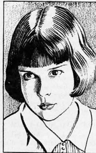
MITZI GREEN in Paramount Pictures

obiskujejo kino, bo dobro znan iz časov nemega filma. Še pred dvema, tremi leti smo ga gledali na filmskem platnu. Bil je eden izmed boljše plačanih filmskih igralcev-umetnikov. Posebno ženski svet je rad gledal filme, kjer je nastopal Kastner. Gotovo se