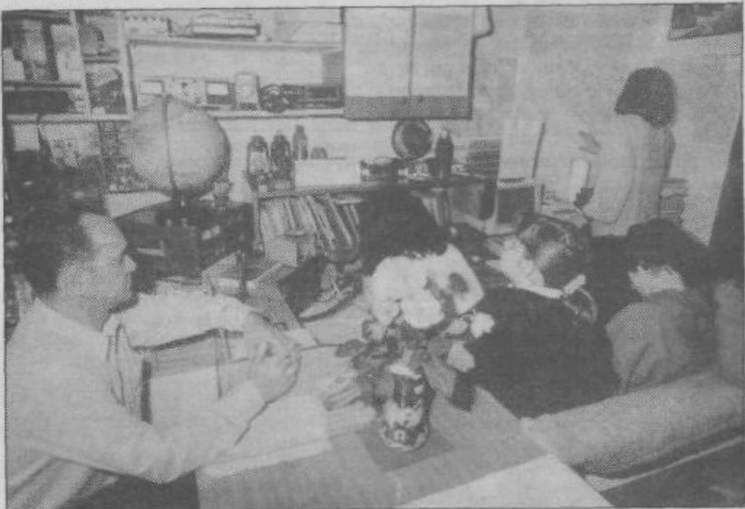
Radioamaterji med pogovorom s Sarajevom.