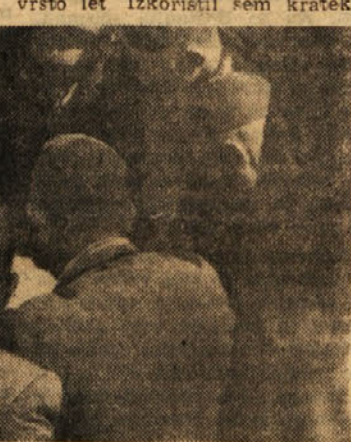
PRI IGRANJU »DAME«

Obiskala sva največjo trgovsko hišo mesta, »NA-MO«. Ta postaja že pretesna, čeprav so skrajša menili, da bodo njeni prostori zadostovali za lepo vrsto let. Izkoristil sem kratek