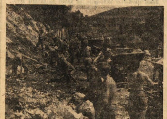
TAM, KJER VSAK DAN HRUMI BRIGADIRSKA PESEM

Spet brzi naš avtomobil. To pot še nekaj kilometrov proti Mirni pečl in se malo naprej do Dolenje vasi pri Sentjurju. V