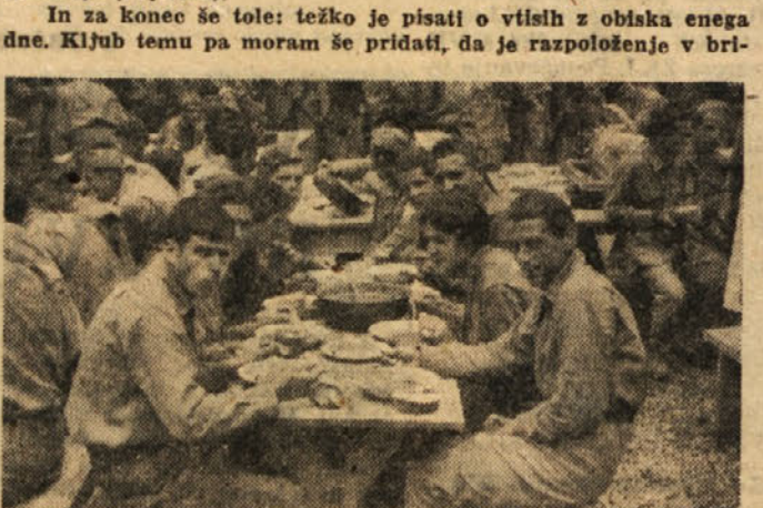
KAKOR ZNAJO MLADI GRADITI, TAKO ZNAJO TUDI MOJSTRSKO VITETI ZLICE.

In za konec še tole: težko je pisati o vtisih z obiska enega dne. Kljub temu pa moram še pridrati, da je razpoloženje v bri-