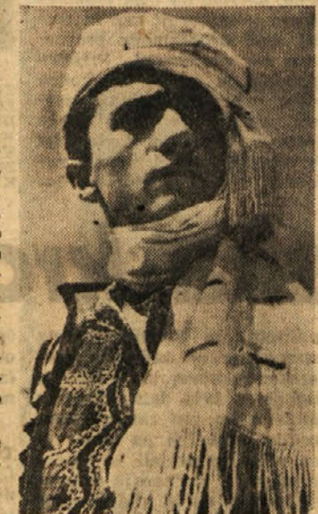
NARODNA NOSNJA Z OVČJEGA POLJA

Tudi stari del mesta je po svoje zanimiv. Že v prvem se-