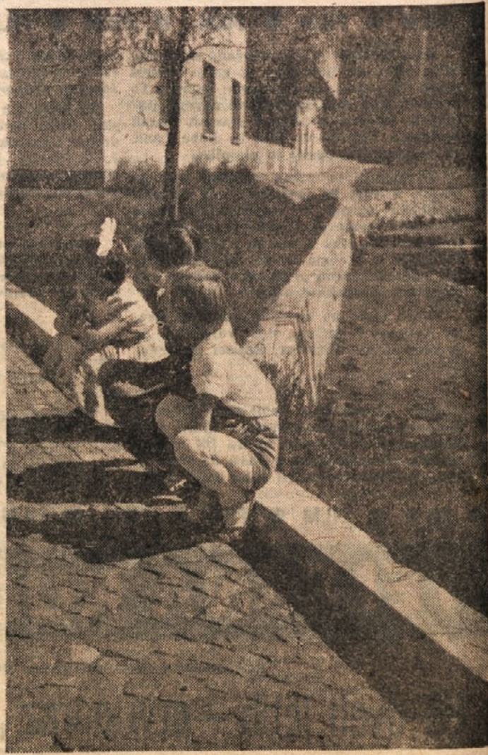
KAM SO SE ZAGLEDALI!

Tokrat ni šlo za kakšno politično demonstracijo, temveč so žene in dekleta tega angleškega mesta v spreduvu izražale svoje ogorčenost nad novo modo — nad tako imenovanimi »vračami«. Zbrale so se na mestnem trgu in v prisotnosti nekaj tisoč gledalcev sezgale nekaj najmodernejših stvaritev parizkih modnih hiš.