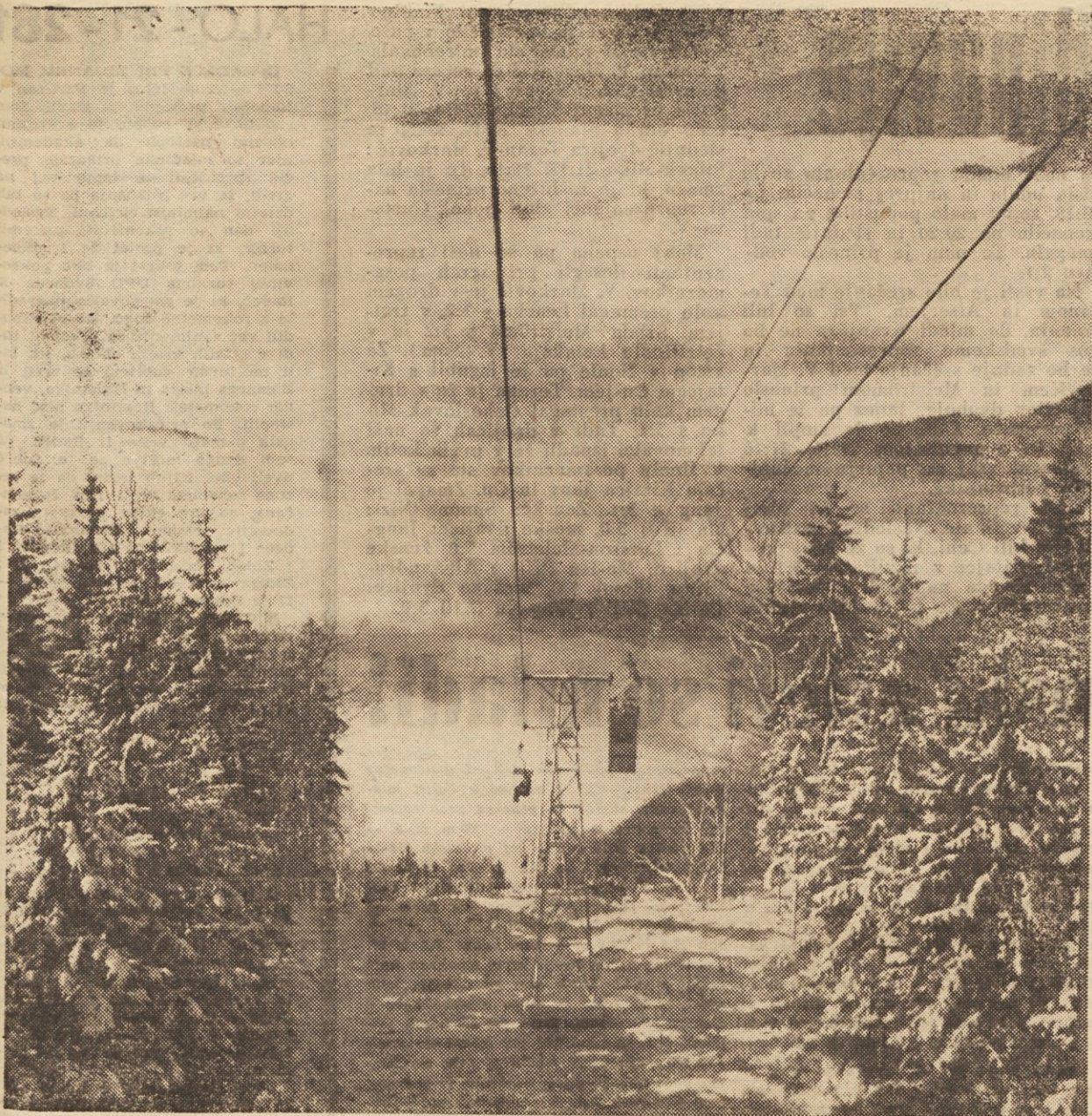
Sneg je pobelil naše vrhove Julijcev in Kamniških Alp. Za Dan republike so se mnogi turisti in smučarji podali na prostrana smučišča Krvavca, Velike planine in Komne. Naš posnetek nazorno prikazuje vzpenjačo na Krvavec in sicer tokrat z vrha navzdol, obenem pa se odpira lep pogled na megleno morje proti ljubljanski kotlini.