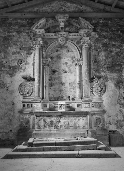
4. Alessandro Tremignon (?), glavni oltar, druga polovica 17. stoletja. Labin, cerkev sv. Antona Padovanskega

pa je bil, poleg Giuseppa Sardija, tudi Alessandro Tremignon. 37 Če oltar Žalostne matere Božje primerjamo z drugimi Tremignonovimi oltarji, kot so na primer oltarji v hvarski katedrali (sl. 5) ali stranski oltar v Marijini cerkvi na Stari Gori nad Čedadom (Castelmonte), je razvidno, da oltar slogovno zagotovo lahko umestimo v arhitektov opus. 38 Iz ohranjenih izplačil kamnosekom februarja 1807 izvemo tudi, da so Tremignonov oltar sv. Hieronima februarja leta 1807 nekam prenesli. 39 Tako je iz vseh zbranih podatkov mogoče sklepati, da je bil oltar prenesen samo