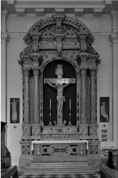
9. Oltar sv. Križa, prva polovica 18. stoletja. Koper, stolnica, provenienca: nekdanja servitska cerkev, Koper