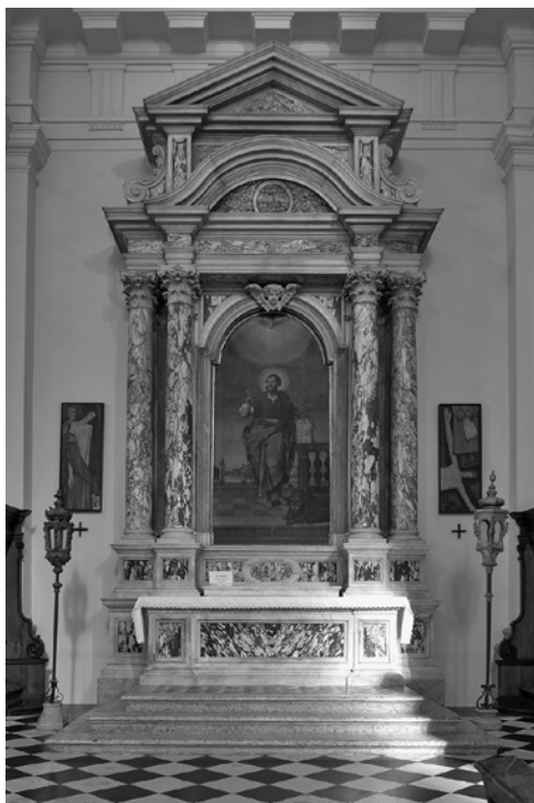
6. Oltar sv. Marka, 1743–1749. Koper, stolnica

minikanske cerkve: »fattura di muratore per selciare li rami delle lapidi sepolcrali levate a S. Domenico«. 50 Zakaj so oltarjema med menzo in nastavkom dogradili del iz rdečega marmorja, ne vemo. Morda so ju želeli povečati, saj sta še vedno najmanjša oltarja v stolnici, čeprav sta bila povečana za dobrih 20 cm.