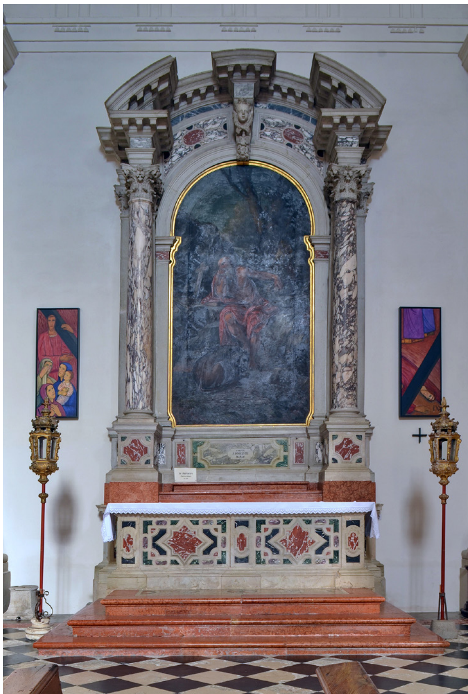
[Turk 1] Oltar sv. Hieronima, ok. 1670. Koper, stolnica, provenienca: nekdanja dominikanska cerkev, Koper