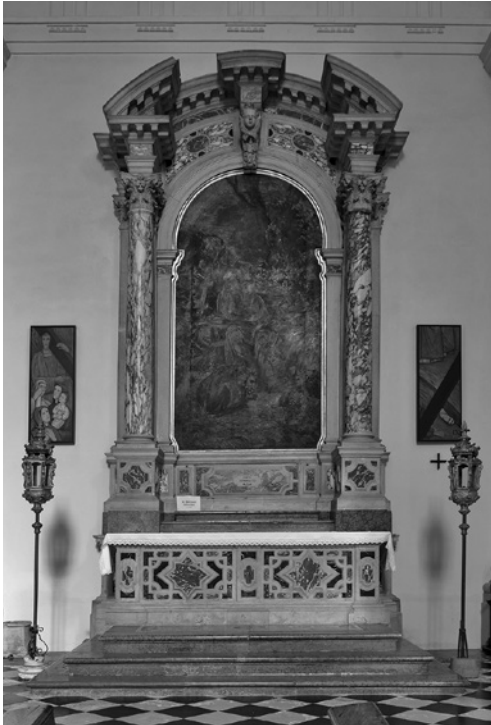
1. Oltar sv. Hieronima, ok. 1670. Koper, stolnica, provenienca: nekdanja dominikanska cerkev, Koper

pa jih je leta 1999 v celoti popisal Massimo De Grassi v topografskem kompendiju Istria, città maggiori . 12 Provenienci stolničnih oltarjev je v približno istih letih nekaj več pozornosti namenil Vittorio Luglio, 13 opremo, prineseno iz ukinjenih cerkva, je v prispevkih o koprskih bratovščinah obravnavala Zdenka Bonin, 14 leta 2007 pa je Helena Seražin, po ponovnem pregledu arhivskih dokumentov o baročni prenovi stolnice, bolj natančno opredelila nastanek dveh stolničnih oltarjev, nastalih po Massarijevih načrtih, oltarja sv. Marka in nekdanjega oltarja sv. Roka. 15