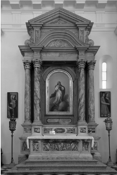
7. Oltar Brezmadežne, 1748–1750, 1806/1807. Koper, stolnica

Giambattista Bettini iz Portogruara jo je ob prisotnosti prokuratorjev cerkve Benvenuta Gravisija in Alviseja Tarsije podpisal 18. novembra 1743. 55 Prenos delov oltarja v Koper in postavitvev lahko spremljamo v blagajniški knjigi med letoma 1744 in 1749, 56 oltarna slika pa je bila nanj nameščena maja 1750. 57 Podpisana pogodba zajema opis naročenega oltarja, poleg pogodbe pa je bil na posebnem dokumentu napisan tudi celoten seznam materiala za posamezne dele oltarja s predvidenimi cenami. 58 V pogodbi je zavedeno, da mora biti telo oltarja narejeno iz genoveškega marmorja, stopnice iz veronskega marmorja ( mandolato di Verona ), njegovi štirje