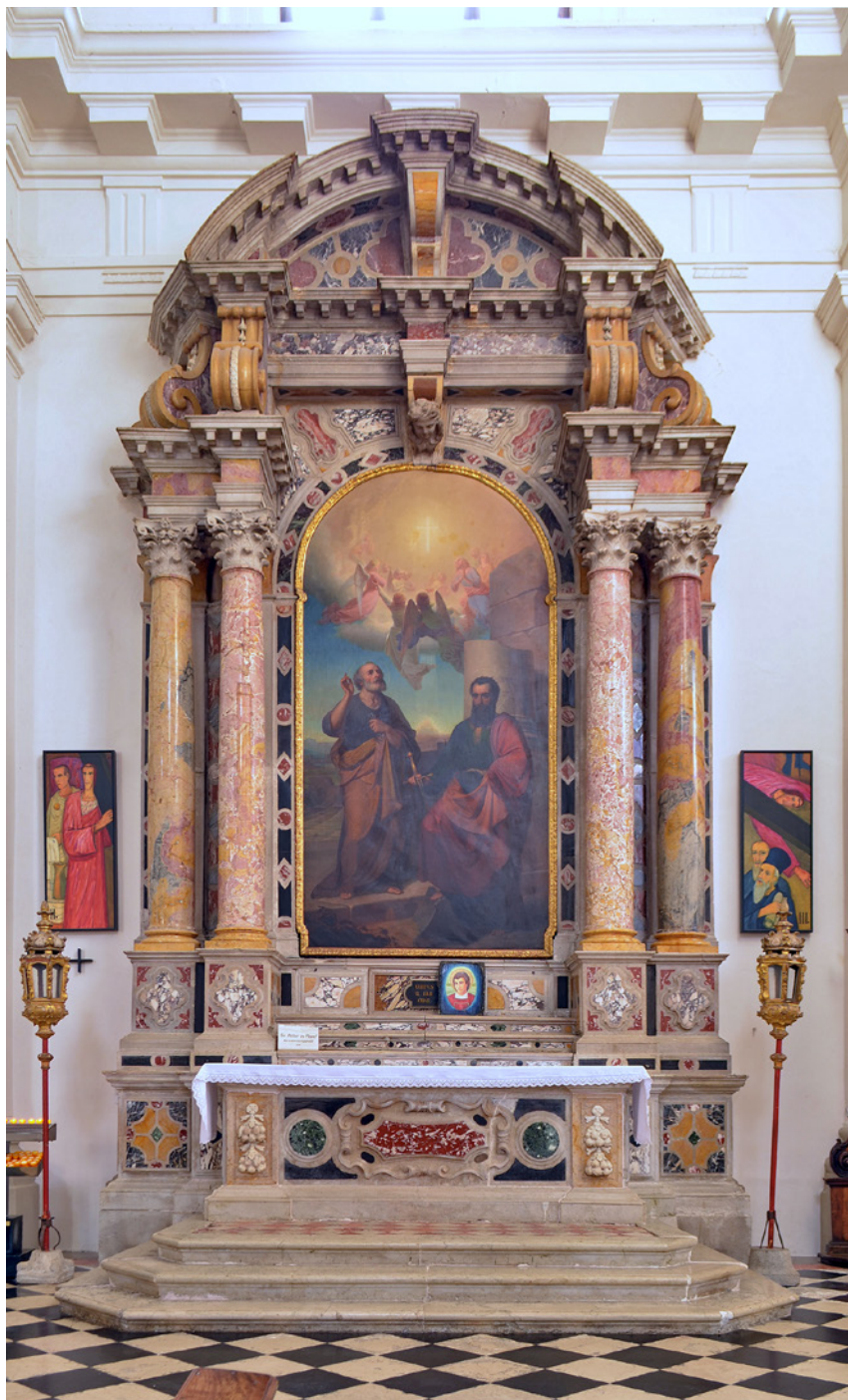
[Turk 10] Oltar sv. Petra in Pavla, prva polovica 18. stoletja. Koper, stolnica, provenienca: nekdanja servitska cerkev, Koper