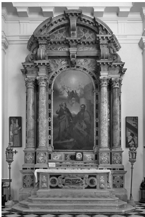
10. Oltar sv. Petra in Pavla, prva polovica 18. stoletja. Koper, stolnica, provenienca: nekdanja servitska cerkev, Koper