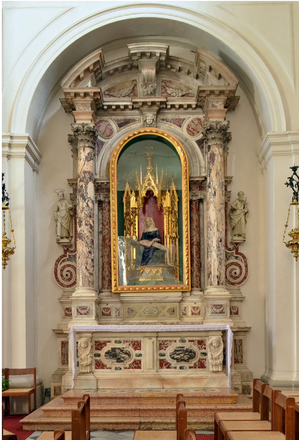
[Turk 3] Alessandro Tremignon, oltar Žalostne Matere Božje, 1669–1670. Koper, stolnica