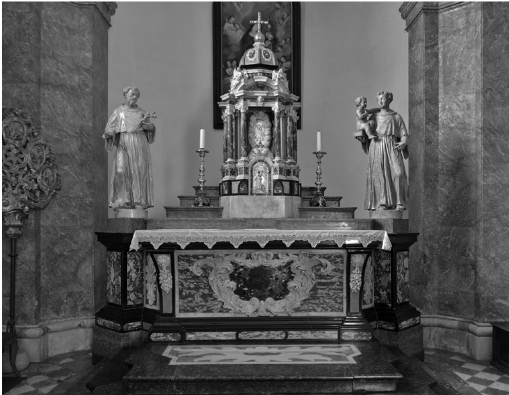
11. Oltar sv. Zakramenta, prva polovica 18. stoletja. Koper, stolnica, kapela sv. Zakramenta, provenienca: nekdanja cerkev sv. Klare, Koper

V levi kapeli ob koru je oltar sv. Zakramenta (sl. 11). Za izvor oltarja se v lokalni koprski literaturi pojavljata dve tezi. Alisi je namreč zapisal, da je bil oltar leta 1806 prinesen iz ukinjene cerkve sv. Klare, Semi, po katerem je provenienca povzela večina kasnejših piscev, pa, da je bil prinesen iz ukinjene frančiškanske cerkve. 89 Ohranjen seznam prinesenih oltarjev ob ukinitvi cerkvenih ustanov reši vsako negotovost v zvezi z njegovo provenienco, saj dokumentira, da sta bila v cerkev prenesena tabernakelj (skupaj z oltarjem) iz ukinjene cerkve sv. Klare. 90 Po ukinitvi cerkve sv. Klare je bil leta 1806 narejen tudi popis cerkvenega imetja, kjer je naveden glavni oltar, izdelan iz finega marmorja s tabernakljem in dvema podobnima figurama, ki ga je takratni cenilec Domenico Dongetti ocenil na 1.600