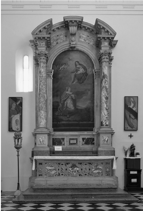
2. Oltar sv. Barbare, 1668–1673. Koper, stolnica, provenienca: nekdanja dominikanska cerkev, Koper