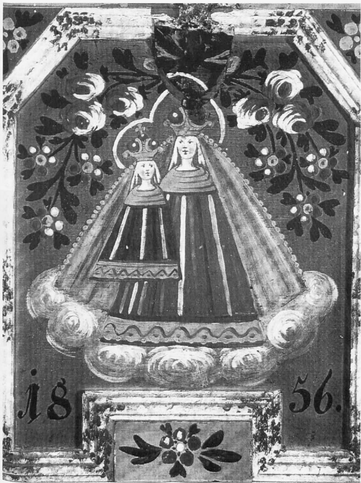
Čelna stran poslikane skrinje z upodobitvijo božjepotne Marije. Iz zgornjesavske doline, z letnico 1856.