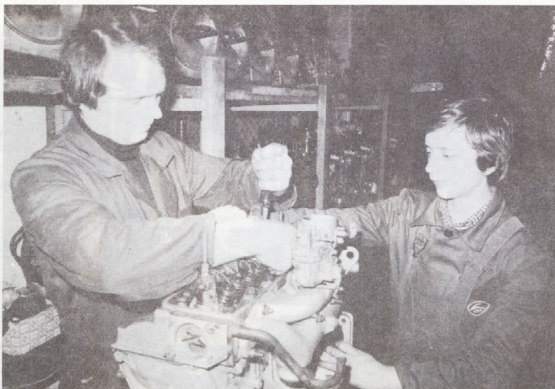
Pravice, ki jih imamo v skladu z našimi samoupravnimi akti, izhajajo iz opravljanja naših dolžnosti.