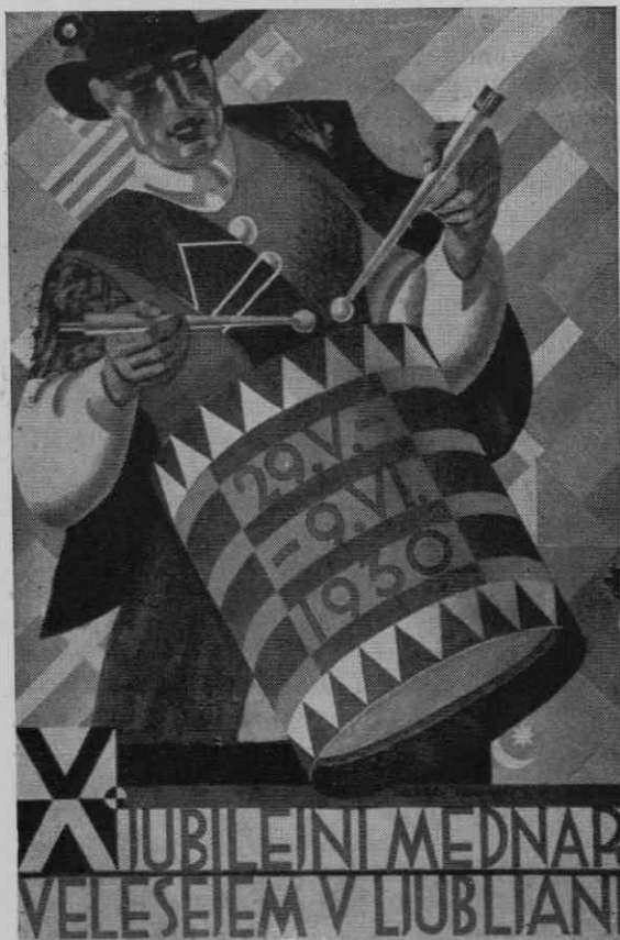
Ljubljanski velesejem je bil važno posredovalno sredstvo med domačo in tujo industrijo ter merilo za napredek

Četrto mesto prisojam Mokronoški tovarni usnja v Mokronogu. 31 Kot družba z omejeno zavezo je bilo podjetje utemeljeno leta 1930 in je zaposlovalo v letih pred okupacijo od 180 do 200 delavcev ter okoli 250 KM. Vred-