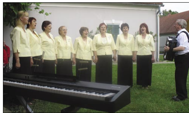
Sombotelske spominčice spejvajo pred Pavlovim izov