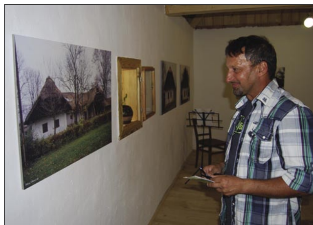
Na razstavi so fotografije stari ramov, kakšni že trno malo vidimo po Goričkom pa v Porabji tó

partneri na slovenski in madžarski strani granice - tau pa so Center za zdravje in razvoj Murska Sobota, občini Gornji in Dolnji Senik, Državna slovenska samouprava in Javni zavod Krajinski park Goričko - od Evropske unije za projekt Saused k sausedi dobila neka več kak devetsto gezero evrov. Tak že znamo, ka je Državna slovenska samouprava na Gorenjom Seniki že lansko gesen odprla Küharjevo spominsko