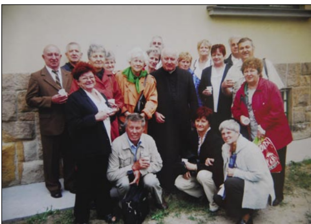
Člani slovenskega društva iz Budimpešte