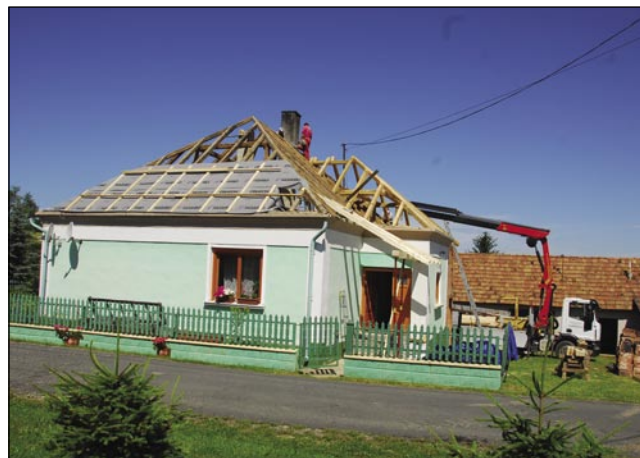
Gnesnaden delo bole brž dé, ka mašini tō pomagajo

»Včasi je bilau kaj, dapa trno dosta nej. Malo si človek takšnoga reda zmišlava, malo plane vōpogledne, vōzračuna, pa te že mora titi.«