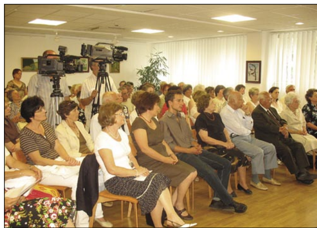
Nabito polna dvorana v Sombotelu