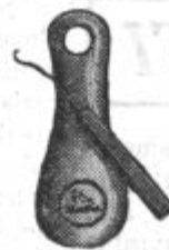
Žilca in kljukica 4 Din.

Naši gumijasti kopalni čevlji Vas najbolje obvarujejo, ko hodite po razžarjenem pesku in ostrem kamenju. Lahki so in udobni.