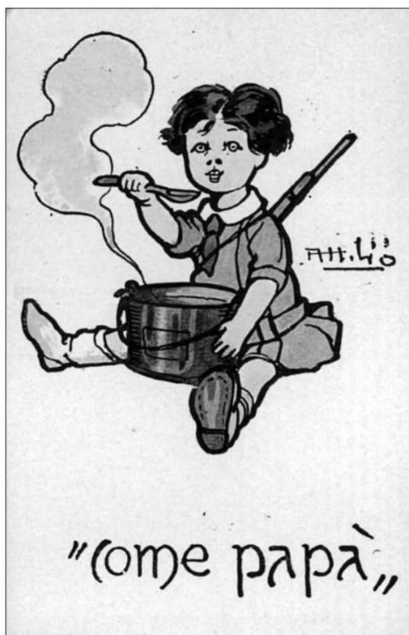
Kot očka

Kljub relativno dolgemu obdobju miru je bila ideja vojne ves čas prisotna. Družba je bila prežeta z militarizmom. Otroci so se s podobami uniform in orožja srečevali od najnežnejših let naprej. 18 Vojska je uživala velik ugled in z militarizmom prežeta vzgoja nikakor ni bila vsiljena od zunaj. Družine, kjer se je prenašala iz roda v rod, so bile večinoma strogo patriarhalno urejene, z jasno strukturo poveljevanja in poslušnostjo kot temeljem vzgoje. 19 Ob dejanskem izbruhu vojne so bili v vojno simbolno vpoklicani tudi otroci. Pozivali so jih k donacijam denarja, izdelovanju nogavic in šalov za vojake na fronti, predvsem pa naj bi svojo vlogo odigrali doma – z učenjem, vzornim vedenjem in visoko moralo naj bi prenesli vse žrtve, ki jih je vojna zahtevala tudi od njih. Bili so simbol prihodnosti, upanja na svetlejšo prihodnost, ki naj bi prišla po koncu spopadov. Šolski sistem naj bi