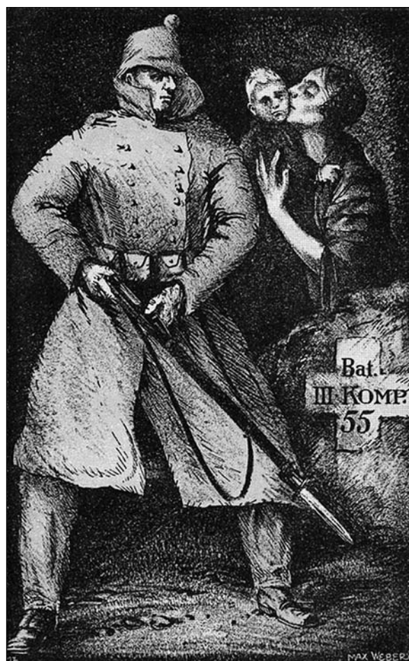
Hrabri vojak doma za seboj pušča ženo in otroka.

Od uvedbe splošne vojaške obveznosti leta 1868 se je utrjevalo prepričanje, da vojska vzgaja prave moške in da moškosti brez služenja vojaškega roka ni, saj je nabor predstavljal ritualni prehod iz otroštva v odraslost. Vsak, ki tega koraka ni naredil, je simbolno ostal na ravni otroka. 47 Naborniški sistem naj bi gradil zavest o skupni pripadnosti, poleg tega naj bi omogočil širjenje temeljne kulture tudi med osebe, ki so sicer prihajale iz deprivilegiranih območij, s tem pa dvig splošne izobrazbe. Vojake so osveščali o pomenu preventive, higiene in skrbi za lastno telo. Pregled pred začetkom služenja vojske je bil priložnost za podrobno analizo zdravja in telesnih sposobnosti mladih moških, analizo epidemiološkega stanja ter spremljanje razširjenosti po-