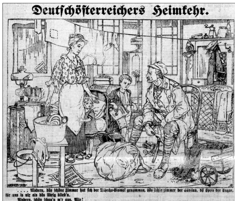
Grenko razočaranje po vrnitvi domov ( Der Morgen , 11. 11. 1918)

Po prvem olajšanju, ki je sledilo vrnitvi, je precej hitro sledila streznitev. Predvsem pripadniki poraženih vojsk so imeli občutek, da je bila njihova žrtev zaman. Domov se niso vračali heroji, temveč invalidi, poraženci, polni uši, ter nosilci bolezni, predvsem tifusa in gripe. Velika večina je imela zelo veliko težav pri privajanju na novo