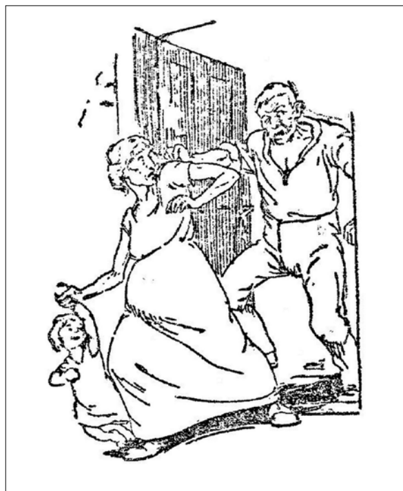
Žene in otroci so bili pogosto žrtve nasilja. ( Die Unzufriedene , 22. 12. 1923)

Žene nasilnih mož so bile v še bolj nezavidljivem položaju, saj so bile od njih popolnoma odvisne, poleg tega so morale skrbeti za mladoletne otroke. Žene so v prijavah nasilja tožile nad neznosnimi razmerami po vrnitvi mož z bojišč. Grdo ravnanje, nasilje in alkoholizem so načenjali družinsko srečo, država in cerkev pa sta od žen kljub temu pričakovali popolno poslušnost in brezpogojno zakonsko zvestobo. Ženske so navkljub vsemu vedno bolj odločno zahtevale sodno varstvo, o čemer priča tudi naraščajoče število zahtev po ločitvi, 104 že v letu 1919 pa se je začela tudi javna razprava o uzakonitvi ločitvenih postopkov, v kateri so avtorji bolj ali manj neposredno namigovali na dogajanje med štirimi stenami. Ločitev se je neposredno po koncu vojne uveljavila kot izhod v sili, ki so ga ženske uporabljale takrat, ko je bilo ogroženo njihovo življenje in življenje otrok, čeprav je šel javni diskurz na Slo-