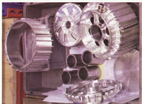
rezultat konstrukterjevega dela

Vsi se učimo in si izmenjujemo informacije ter s tem prelivamo znanje in izkušnje. In pri takem projektu se vidi, kako pomembno je sodelovanje vseh služb, kajti če en člen v verigi zataji, to pomeni najmanj en teden zamude, da spet pride v tek z dogajanjem.