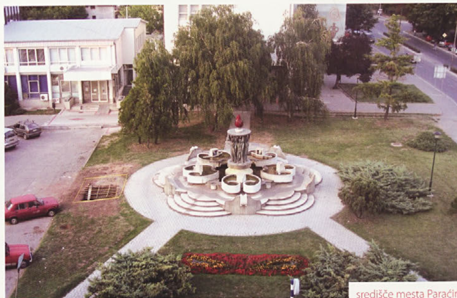
središče mesta Paraćin

Crna trava nima zgodovinskega vira, s katerim bi lahko natančno opredelili njeno ime. Obstaja pa legenda o imenu, ki izhaja iz leta 1389 in je vezana za Kosovsko bitko. Po tej legendi se je ena četa srbske vojske, sestavljena iz srbskih strelcev in jahačev, ki so potovali do bojnega polja, odločila, da se spočije na zelenem polju. Vojaki so ležali na odprtem polju, ki je bilo pokrito s strupeno travo in cvetjem. Od tega so bili omotični in se niso do časa zbudili za bitko. Ko so to dojeli, so prekleli travo, na kateri so ležali, in je proglasili za »črno« travo.