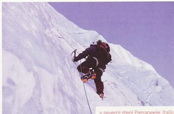
v severni steni Presaneele, Italija