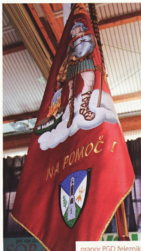
prapor PGD železniki