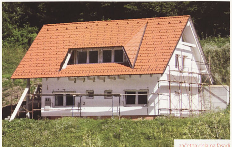
začetna dela na fasadi