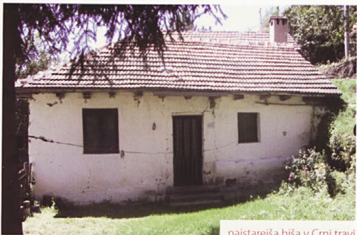
najstarejša hiša v Črni travi

Za zaključek lahko povem še to, da je Srbija velika država z veliko neizkoriščenimi površinami in prostori. Vsekakor priporočam vsem, ki radi potujete, da obišečete to državo, saj boste lahko videli veliko zanimivega.