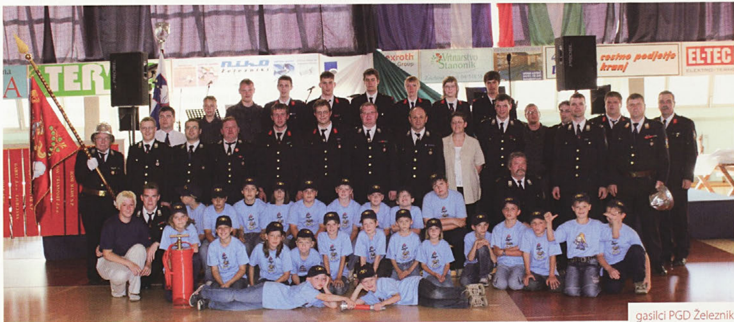
gasilci PGD Železniki

Ogenj in voda. Dva človekova najboljša prijatelja, pa tudi dva človekova najhujša sovražnika, če do njih ne goji dolžnega spoštovanja ali če jih obravnava tako, kot da sta mu samoumevno dolžna služiti in nuditi vse ugodje brez kakršne koli nevarnosti. Tudi danes, kljub vrhunski tehnologiji in osvajanju vesolja, še nismo našli načina, kako zagotoviti stoddostno varnost, da nam ta dva velika prijatelja, ki sta nam mimogrede omogočila tudi ves napredek in razvoj, ne bi povzročala ogromne škode in nevarnosti, tudi za človeška življenja. Tako nam ne ostane nič drugega, kot vložiti vse napore in znanje v to, da nevarnost njihovega nenadzorovanega delovanja preprečimo. Torej preventiva. Strah pred ognjem je pravzaprav človeku prirojen. Vse prevečkrat pa zaradi svoje nepoučenosti, malomarnosti, brezbriznosti in podobnega sam sebe postavlja v takorekoč brezizhoden položaj in nevarnost. Mogoče pa bomo kdaj spoznali, da narava in njene sile še kako dobro in pošteno služijo človeku, če jim vrača s svojim pravilnim obnašanjem.