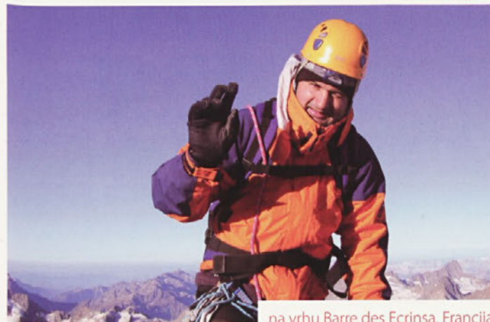
na vrhu Barre des Ecrins, Francija