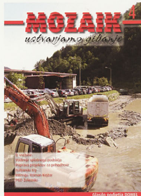
Na naslovnici: Domel se vrača v ustaljene tire