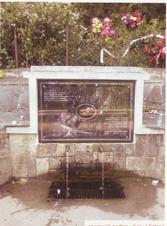
spomenik padlim v boju z Bolgari