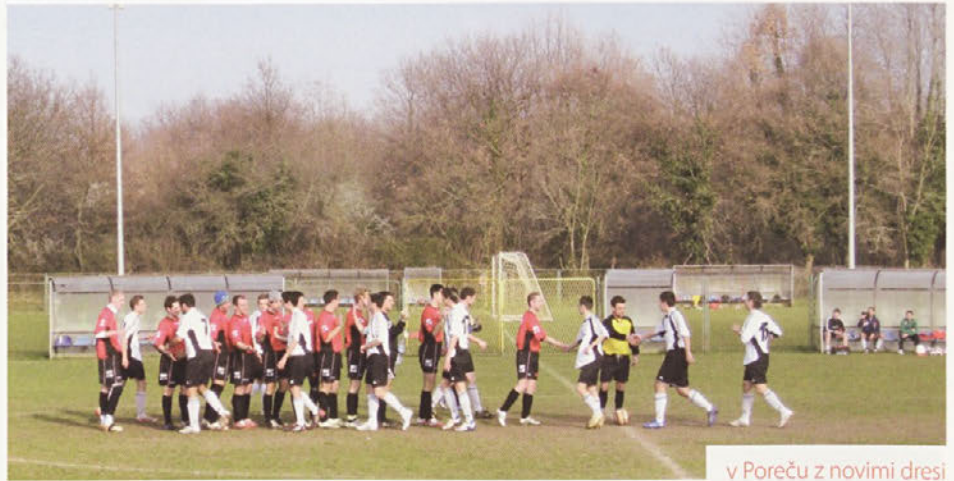
v Poreču z novimi dresi

Možnost treninga na umetni travi je ob vsakem vremenu. Na naravni travi treningi v deževnem vremenu odpadejo. Jasno, nimamo