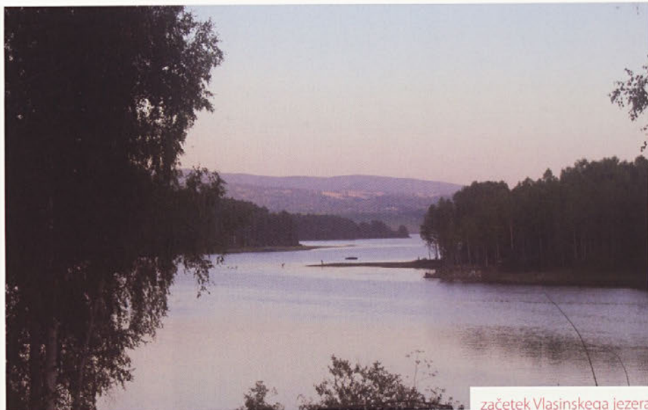
začetek Vlasinskega jezera

Naslednji dan se odpravim proti Crni travi.