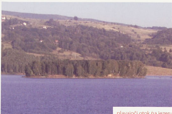
plavajoči otok na jezeru

Naslednji dan se odpravim proti Vranju, ki je od Vlasinskega jezera oddaljeno 90 km. Vranje je mesto, ki je najbolj znano po Vranjski banji (toplicah). Danes so to toplice z najtoplejšo vodo v Evropi (96 stopinj Celzijeve). Nekoč je bilo v Vranju veliko podjetij, ki so s svojimi izdelki oskrbovala celotno bivšo Jugoslavijo. To so bila podjetja: Yumco (tovarna oblek), Koštana (tovarna čevljev), Simpo (tovarna pohištva).