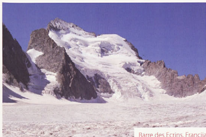
Barre des Ecrins, Francija

svojo zgodbo, ki se je rad spominjam. Ni se mi še zgodilo, da se na vrhu preplezane smeri ali hriba ne bi dobro počutil. Več energije, ko vložim na poti navzgor, bolje se na vrhu počutim. Še bolje pa se počutim kasneje v dolini, ko ob hladnem pivu gledam navzgor proti hribom in si mislim: »Glej, tam gor smo bli...«