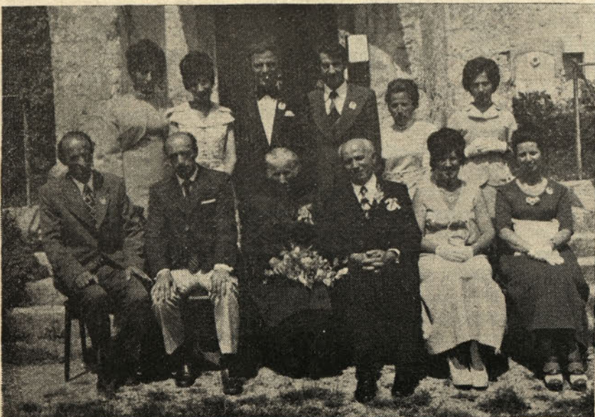
Zlatoporočnica v sredi desetih hčera in sinov