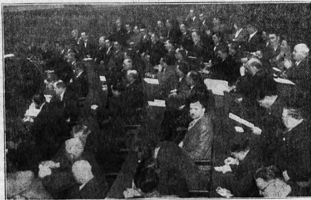
Predkonferenca delegatov za kongres v Zagrebu.