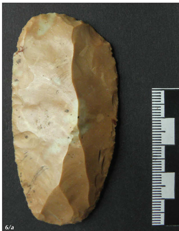
Slika 6/a. artefakt – dorzalna stran

Praskala so bila ponavadi nasajena v lesen, koščen ali rožen ročaj. Tudi v našem primeru lahko sklepamo na nasaditev. Ker je orodje izdelano na debelejši klini, je bilo na dorzalni strani bazalnega dela naknadno stanjšano z dvema dobro merjenima udarcema. Rezultat sta dva izrazita negativa odbitka na dorzalni strani. Stanjšanje bazalnega dela je omogočalo lažjo nasaditev v ustrezni ročaj. Ohranjeni talon kline, na katerem so vidni sledovi predhodne obdelave udarne ploskve jedra, je zaradi stanjšanja bazalnega dela dokaj tanek. Bulbus in udarni valovi na ventralni strani so dobro izraženi. Klina je bila od masivnega jedra odbita bodisi s tehniko direktnega odbijanja z mehkim tolkačem bodisi s tehniko indirektnega odbijanja (glej: Pohar 1979, 18 in 19). Klina je retuširana, izvzemši talon, po celotnem obodu. Oba lateralna robova sta rahlo izbočena in polkrožno