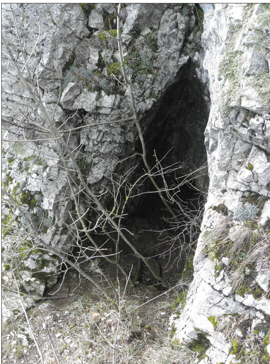
Slika 7. Vhod v t.i. »Četrto jamo« Figure 7 Entrance to the so-called Cave 4

S primerjavo prvotnih Moserjevih objav in kasnejših omemb njegovega izkopavanja v treh jamah v okolici Razdrtega smo razjasnili, v katere jame spadajo v objavah omenjene najdbe. Kljub njegovemu nenatančnemu opisu odkopanih sedimentov v jami Luknja v skali smo s primerjavo treh Moserjevih objav identificirali sedimentacijsko sosledje. Edini kamni artefakt, najden v jami Luknja v skali, ni tipološko značilen, ga pa vseeno umešamo v čas neolitskih kultur. Razloga sta dva. Surovina artefakta makroskopsko ustreza surovini iz območja Monti Lessini v severovzhodni Italiji, od koder se je s pojavom zgodnje neolitske kulture Fiorano v Benečiji