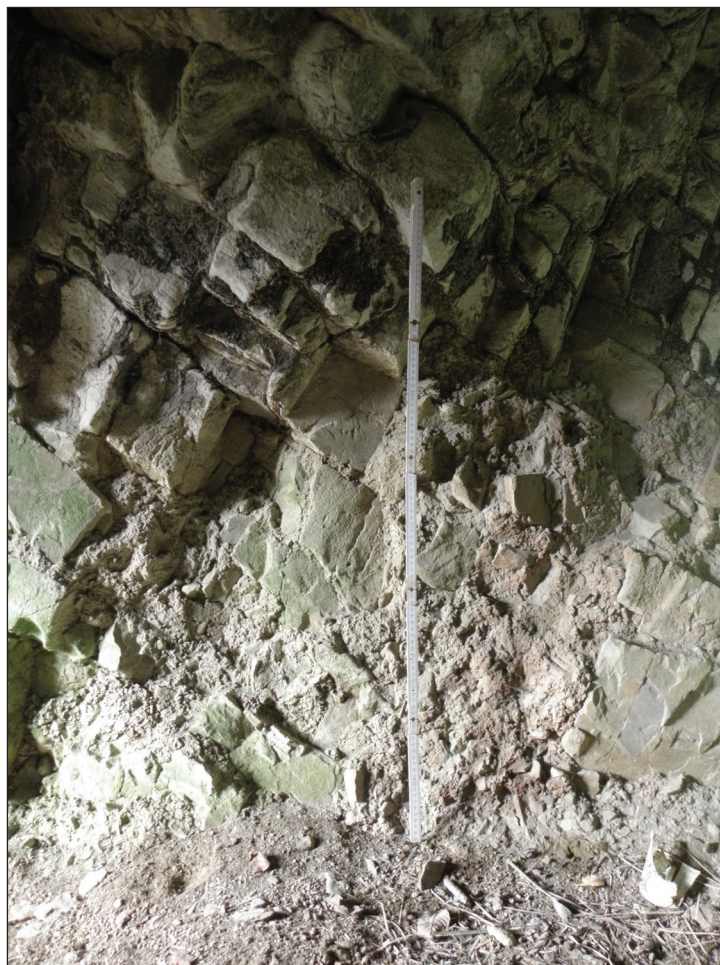
Slika 4. Ostanek ilovnate plasti na jamskih stenah. Figure 4 Loam layer remains on cave wall.

Sosledje plasti, rekonstruirano iz Moserjeve objave, je mogoče potrditi z ohranjenimi sledmi zapolnitve na stenah jame. Na jamski steni je jasno vidna sled fosfatnih