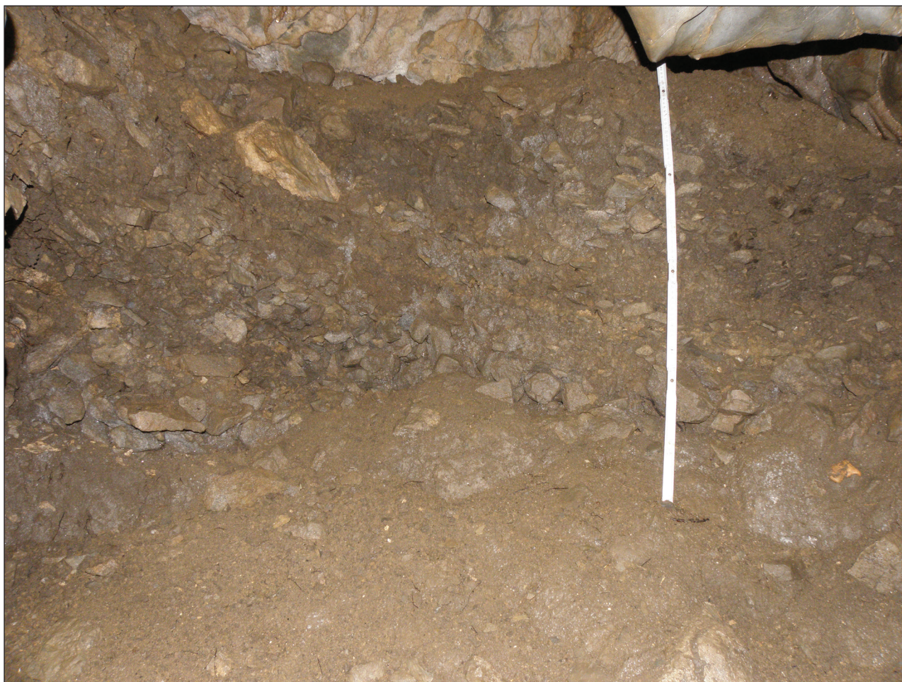
Slika 2. Ohranjen sediment za ožino. Zgornja ilovnato gruščnata plast je ostro ločena od spodnje pleistocenske plasti. Skrajno desno fosilna kost jamskega medveda v spodnji ilovnati plasti.

Figure 2 Preserved sediments following the narrow section. The upper loam and rubble layer is clearly distinguished from the lower Pleistocene layer. On the sharp right, a fossilised bone of a cave bear is seen in the lower loam layer.