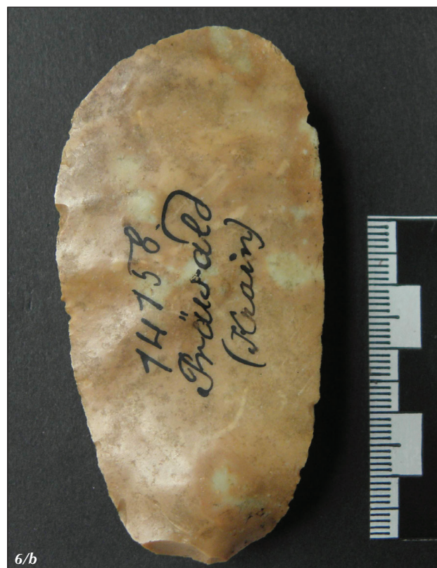
Figure 6/b Artefact – ventral side