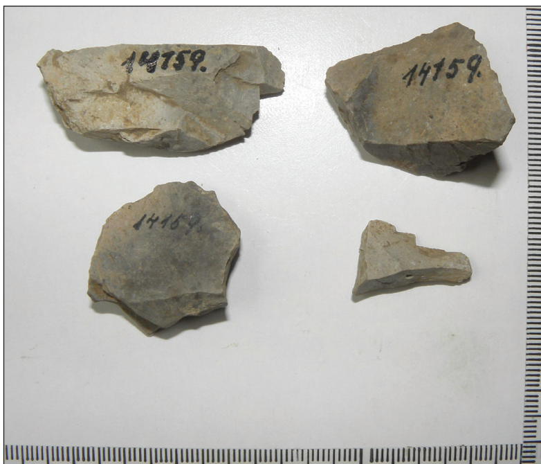
Slika 5. Pet koščkov svetlo sivega apnenca, za katere je Moser menil, da so kamenodobni odbitki. Figure 5 Five light green limestone pieces interpreted by Moser as stone-age chips.

Kamnito orodje pod št. 14.158 je izdelano na široki klini dolžine 78 mm, širine 34 mm in debeline 13 mm. Tipološko ga opredeljujemo kot praskalo na retuširani klini (Pohar, 1978, 12), (SLIKA 6/a, 6/b). Njegova umestitev v arheološka obdobja je težavna. Glede na odsotnost kakršnih koli drugih elementov kamene industrije je temeljno vprašanje, ali izdelek lahko umestimo v plast z jamskim medvedom in ali je Moser artefakt pobral v vrhni humusni plasti in je torej mlajši in ne spada več k paleolitskim kulturam. Tipološko in tehnološko bi se tak izdelek lahko pojavil v kulturnem inventarju vse tja do bronaste dobe. Tokrat nam niso dosti v pomoč niti