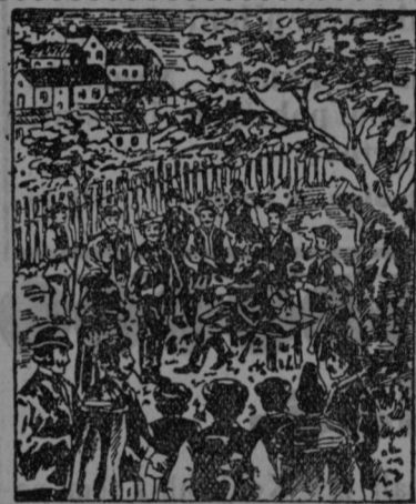
Vidmaric kaže kmetom moč „Pakraških kapljic“ in „Slavonske zeli“.

Pakraške kapljice in slavonska zel, to sta danes dve najpriljubljenejši ljudski zdravili med narodom, ker ta dva leka delujeta gotovo in z najboljšim uspehom ter sta si odprla pot na vse strani sveta.