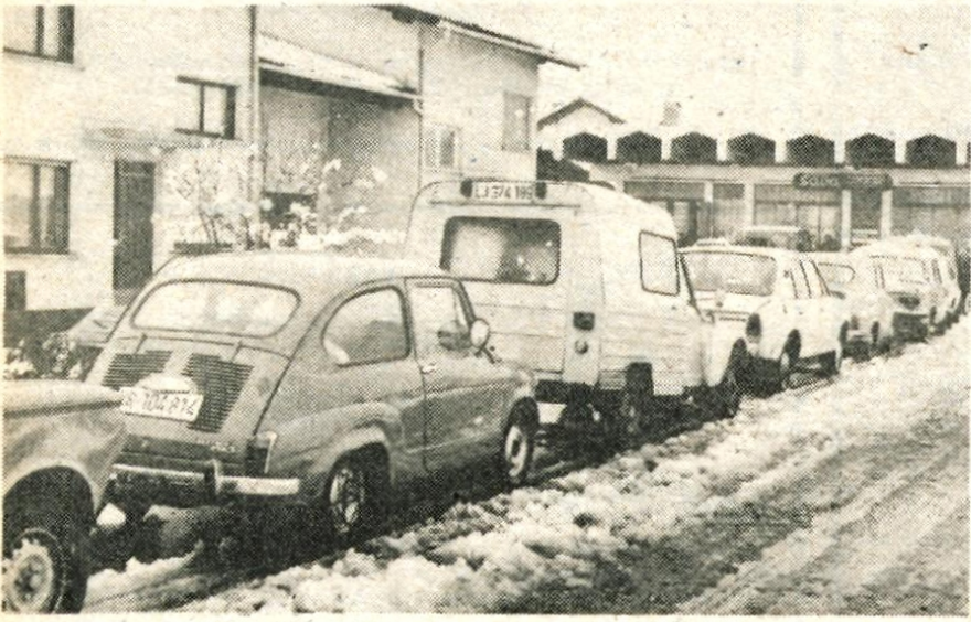
Sneg je presenetil tudi voznike, o čemer priča vrsta na kranjskem servisu za menjavo gum.

Gozdove po vsej Gorenjski je nad 600 metrov nadmorske višine vklestil žled. Gozdna gospodarstva zdaj pregledujejo gozdove in ocenjujejo, koliko škode je v gozdovih, ki so klonili temu ledenemu zlu.