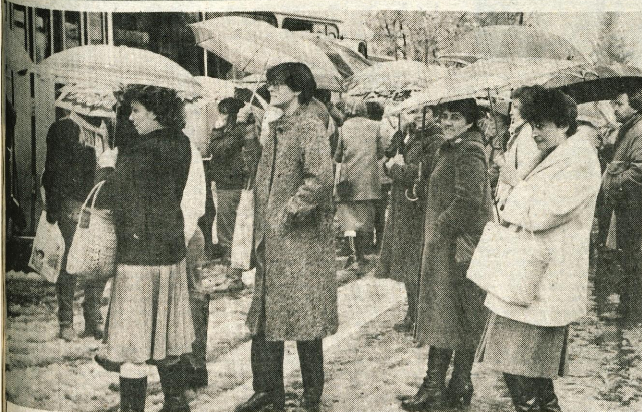
Gorenjsko je pobelil sneg, spet se stežka prebijamo po snežni brozgi na pločnikih. Ceste sicer plužijo, a je avtomobilom že potrebna zimska oprema. Ponekod je drevje vklebil žled. Več o letošnjem navembrskem presečenju na zadnji strani.

GLASILO SOCIALISTIČNE ZVEZE DELOVNEGA LJUDSTVA ZA GORENJSKO