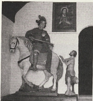
Kapela sv. Martina v Podjelju.

Pri miklavževanju je imela krajevna Cerkev manj srečno roko. V župnijski otroški vrtec je prišel duhovnik. Priplesel je kovček z iglarskimi rekviziti, ga odprl, otrokom razložil zgodbo o dobrem svetniku. Potem so ga otroci oblekli v škofa — Miklavža. Sledilo je obdarovanje, brez angelov in parkeljnov, vse je bilo izvedeno tako racionalno in brezosebno. Za očarljivi domišljjski svet so se otroci lahko obrisali pod nosom. Ko sem „Miklavžu“ omenil svoje pomisleke, mi je postregel z izčrpnimi statističnimi podatki iz pastoralne študije o miklavževanju nekega avstrijskega avtorja: to