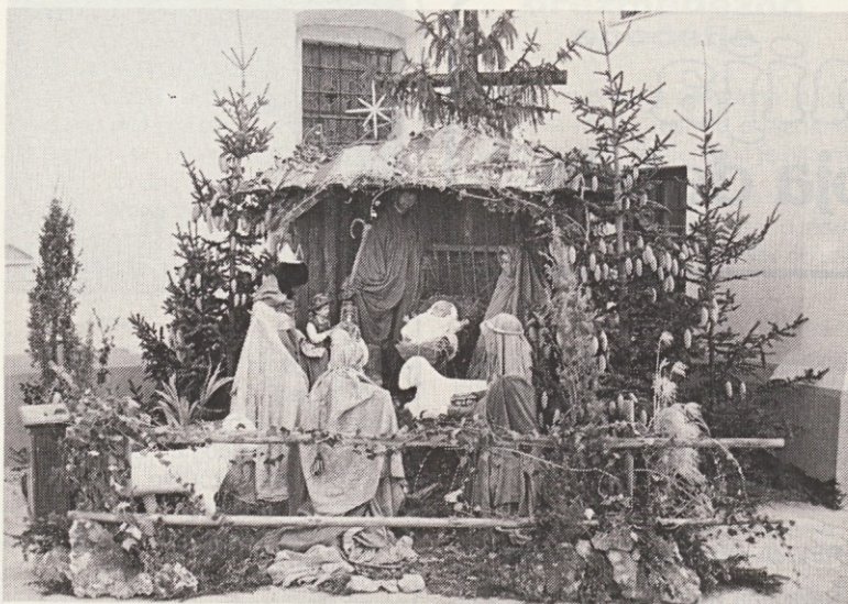
Lepo oblikovane jaslice iz Primskovega pri Kranju.

politiki v zveznih ustanovah. Samo ustrezna zakonodaja lahko napravi red na tem področju.