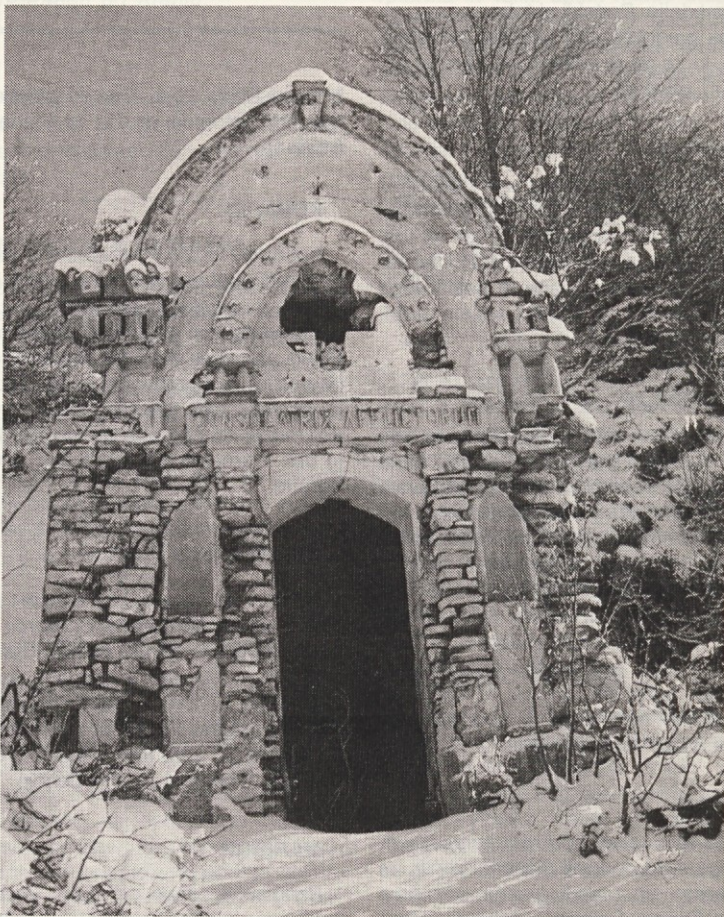
Vojaška kapelica na Planici.

Po štirih letih prizadevanj so dogradili in odprli novo poslopje zdravstvene postaje Žiri. Investicija v zgradbo in opremo je vredna 4,3 milijone DM. Sredstva je v glavnem zbrala občina Škofja Loka, nekaj pa je primaknil zdravstveni dom Žiri. V dveh nadstropjih je 600 kv. metrov pokritih površin za splošne zdravstvene usluge, otroški dispanzer, večnamenska in zobna ambulanta, prostor za patronažno službo, laboratorij in spremljevalni prostori.