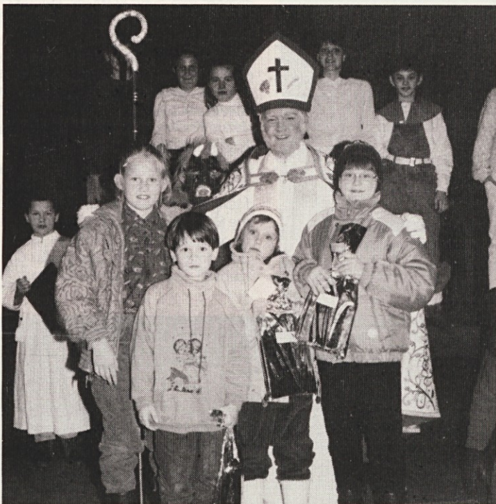
Miklavž v Ravnah na Koroškem