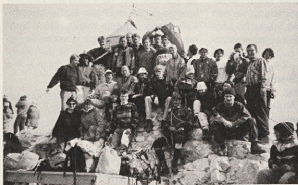
Slovenska mladina iz Stuttgarta na Triglavu 28. julija letos. Lepih doživetij s potovanja po slovenskih gorah ne morejo pozabiti.