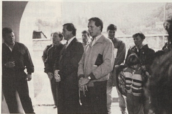
Po kozarcih dobrega vina pa naj se oglasi še pesem.

Vsako leto priredimo v mesecu oktobru t. i. „Dobrodavno veselico“ ali trgatveno zabavo. Letos je bilo to v soboto, 23. 10. Povabili smo original „Murtal Trio“, kjer igrata dva Slovence in en Avstrijec. Zbralo se nas je res veliko, razpoloženje je bilo izredno lepo. Vso