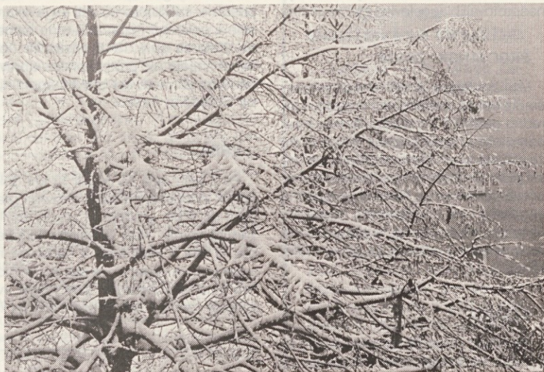
Narava v novi preobleki.

V župni cervki so Argentinci slovenskega rodu ponovili glasbeni večer, za katerega so prejeli glasna priznanja že v Parizu, Celovcu, Ljubljani, Mari-