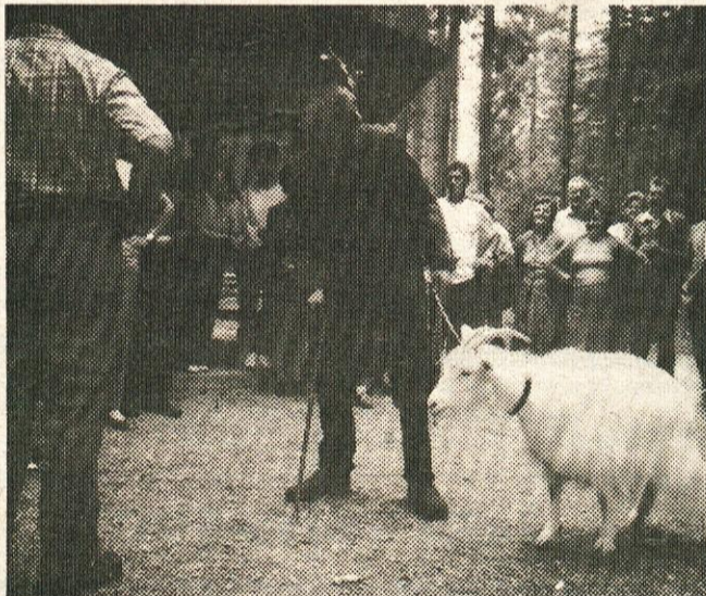
Srečanje v Starem mlinu je popestril »Krvavelj« iz Muliave