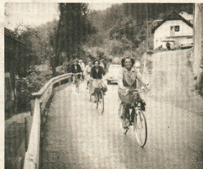
Utrinek s kolesarjenja v Borovnico.