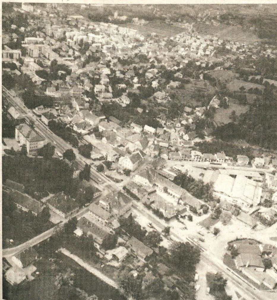
Zadnji posnetek Vrhnike s ptičje perspektive

SVET ZA PREVENTIVO IN VZGOJO V CESTNEM PROMETU