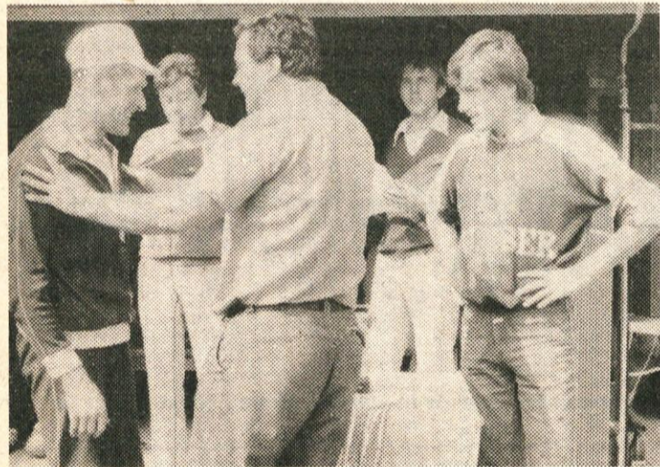
Medalja tudi za Šalamuna

Prijetno presenečenje je bil nastop znanih atletinj in tekmovalcev v teku na smučeh iz Dola. Bregarjeva, Uršičeva in Korošičeva so za seboj pustile precej kolegov in tako dokazale, da tudi kolesarstvo postaja šport nežnega spola.