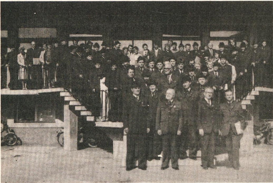
Spominski posnetek ob jubileju