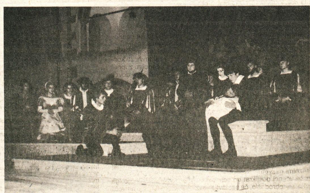
S predstavo »Življenje in smrt Primoža Trubarja«, amaterskega gledališča iz Velikih Lašč, so stekle letošnje kulturne prireditve v Bistri.

Ko so govorili o programu dela, v katerega so si zapisali glavne naloge, so se dogovorili, da ga v osnovnih organizacijah »dodelajo« in program prilagodijo konkretnim interesom mladih vseh struktur.