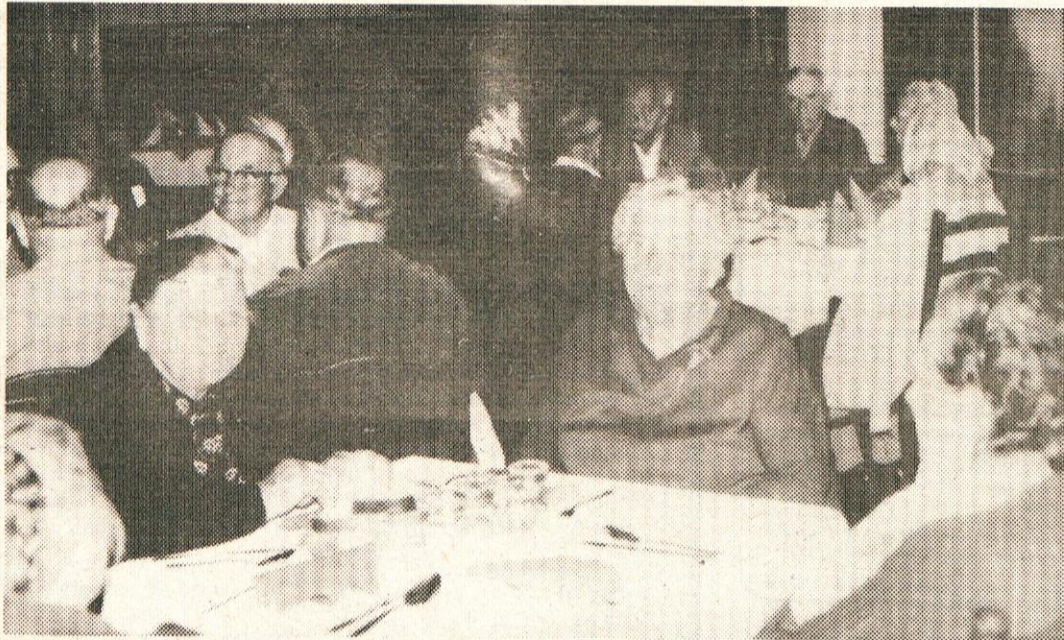
V prijetnem razpoloženju so upokojenci preživeli popoldne v Močilniku.