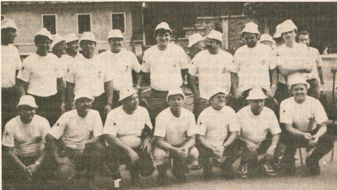
Tu so še pred Mantovo; čez tri dni pa se je menda Triglav za nekaj metrov znižal.

Petkovo jutro je obetalo lepše vreme. Navsezgodaj smo zagrizli v hrib na Soriško planino, kjer sta nas kuharja pričakala s toplim čajem. Potem pa naprej v Bohinj, da se vreme ne skazi, in dalje v Srednjo vas, kjer nas je čakala obilna obara in kjer smo se lahko po dolgem času ogreli na soncu. Po »južni« smo krenili proti koči na Uskovnici, kjer je bilo razpoloženje v zadnjih dveh dneh najboljšje. Toda ne za dolgo. Na poti proti Vodnikovemu domu je začelo grmeti in kmalu nas je močil leden dež. V koči smo prisopihali premrženi in premočeni do kože. Še dobro,