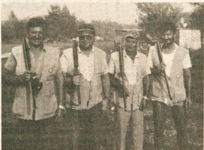
Naši najboljši strelci na glinaste golobe

Od slovenskih tekmovalcev so se le vsi naši strelci kot ekipa uvrstili v play-off, v ka-