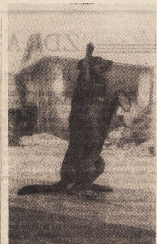
Na Radišah imamo tega psička, ki še danes pozdravlja „Heil Hitler“, če mu kdo obljubi cukrček.