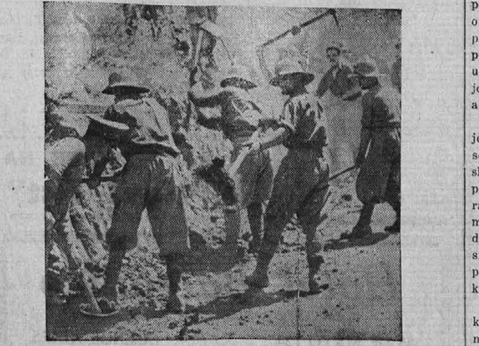
Ker je Italija ojačila svoje posadke v Libiji, je egiptovska vlada poslala na mejo vojaštvo, ki sedaj opravlja razna utrjevalna dela

Jugoslovanska vlada je objavila povodom praznika ujedinjenja ukaz o amnestiji za politične zločine in prestopke. Kakor zagotavlja neko poročilo francoskega obveščevalnega urada "Havas", je bila s to amnestijo 15.000 osebam kaznen popolnoma ali deloma odpuščena. Amnestije niso deležni oni obsojenci, ki so pobegnili v tujino ter se se niso predstavili jugoslovanskim sodiščem. V političnih krogih pa zagotavljajo, da ima vlada, spoznavno z regentskim svetom, namen razširiti pozneje amnestijo tudi na takšne politične obsojence in sicer s posebnim ukazom, vendar pa da hoče prej proučiti položaj vsa kega posameznega izmed njih. Z amnestijo je bil storjen velik korak naprej na poti do popolnega notranjega pomirjenja ter je vlada g. Stojadinovića s tem izpolnila obljube, ki jih je bila dala že pred meseci.