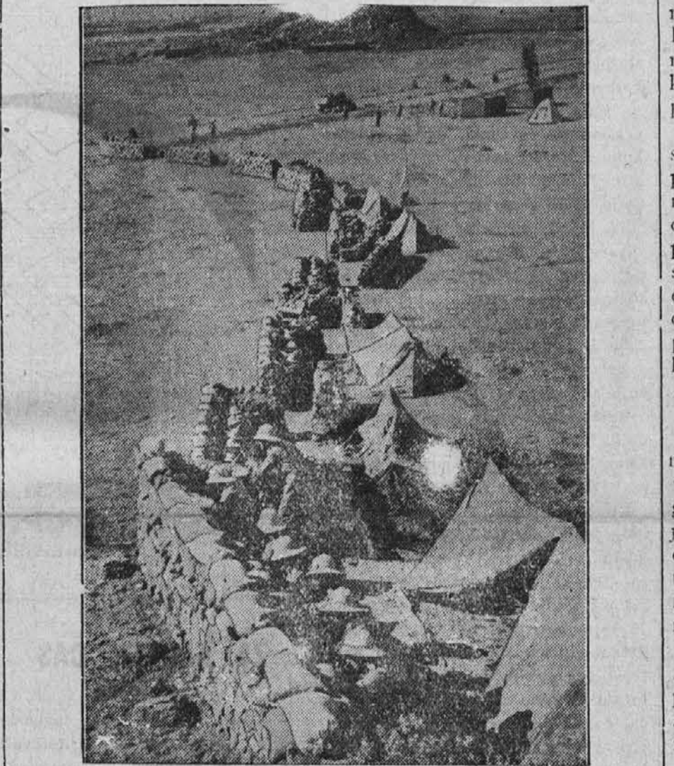
Slika z bojev v bližini Makalleja: sprednje vrste italijanske vojske v pričakanju abesinskega protinapada

Največje zanimanje vlada sedaj za vprašanje, kaj bo Zveza narodov sklenila glede petroleja. Izvedenci soglašajo v prepričanju, da bi se morala Italija ukloniti, če ji "odrežejo" dobave petroleja. Ali se bo to zgodilo? Angleška vlada je morala poslušati v četrtek hude očitke v parlamentu. Oglasili so se govorniki, ki so dejali: Vplivali ste, da se začnejo izvajati sankcije proti Italiji ter razlagali, da postopate tako z namenom, da se čim prej vzpostavi mir. Prav dobro veste, da se bo Italija najprej vdale, če ji zmanjka petroleja. Počemu torej odlašate?