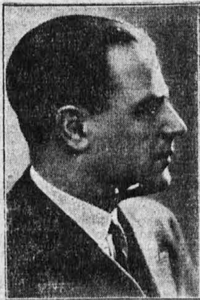
Romunski zunanji minister Gafencu

so v teh dneh morali demantirati veliko neresničnih vestí, ki so se pričele širiti. Zanikali so, da bi bili v Pragi dobili veliko zlata (po sodbi nekaterih listov 3 in pol milijarde Kč), Sicer pa, pristavlja nemško poročilo, bi bilo češko zlato v Berlinu prav tako dobro shranjeno kakor v Pragi. Prav tako se z nemške strani zanikuje vest, da bi bilo število samomorilcev v Pragi naraslo. (Spominjamo se še, da so tudi v času, ko je Nemčija zasedla Avstrijo, skušali nekateri zastrunjavati ozračje s podobnimi vestmi), tudi poročila o množestvenih aretacijah v Pragi in o koncentracijskih taboriščih so po nemških demantiranih vsa iz trte izvita. Sploh so popolnoma resnična in zanesljiva samo poročila, ki jih prinaša DNB po radiju in v časopisih. jad.