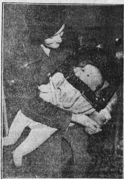
Plinske maske za otroke

VODILNO TISKARSKO PODJETJE SEVERNE SLOVENIJE POSTREŽEMO HITRO, DOBRO IN PO NIZKIH CENAH TELEFON 25-67, 25-68, 25-69