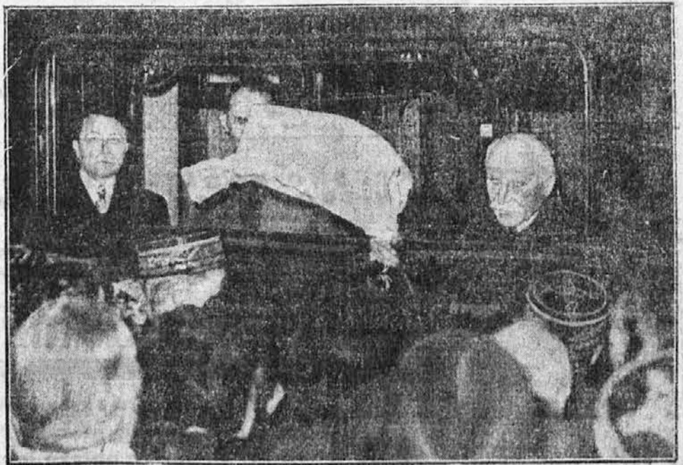
Odhod maršala Péta na v Španijo

Odkar so živeli Židje v tujini (galutu) so hrepeli vedno po svoji prvotni domovini (Crec Israel). Mnogi so prišli kot romarji v deželo svojih očajov, marsikateri so se tudi tam stalno naselili. Tako je imela Polestina v vseh časih vsaj nekaj židovskega prebivalstva. Sistematično naseljevanje se je začelo okoli 1870, ko so nastala v Rusiji vsled pogostih židovskih progromov »Društva prijateljev Cijona« (= griča v Jeruzalemu, kjer je stal Salamonov tempelj; Koveve Zion). Tako so ustanovili ruski oz. poljski Židje zlasti v letih 1882—90 več naselbin v Palestini. Sredstva zato jim je dal predvsem milijarder Edmund baron Rothschild. To gibanje se je razširilo proti koncu prejšnjega stoletja tudi na zapad. Neposreden povod zato je dala Dreyfušova afera 1895. Kakor je znano, je bil takrat obsojen francoski kapetan Žid Alfred Dreyfuš radi spionaze v prid Nemčiji. Izkazalo pa se je — zlasti po prizadevanju romanopisca Emila Zolaja (»J'accuse«) — da je bila obsodba krivična in le plod antisemitizma. Takrat je nastopil tudi židovski pisatelj in novinar Teodor Herzl (u. 1904), ki se je v številnih spisih, zlasti v svojih delih »Der Judenstaat« in »Alt-Neuland« zavzemal zato, da ustanove Židje v Palestini svojo lastno državo. Njegov najzvestejši sotrudnik je bil zdravnik in pistatelj Maks Nordau. Ta dva moža sta začetnika modernega cijonizma. V avgustu 1897 sta sklicala v Bazlu prvi cijonistični kongres, ki je določil, da »ho-