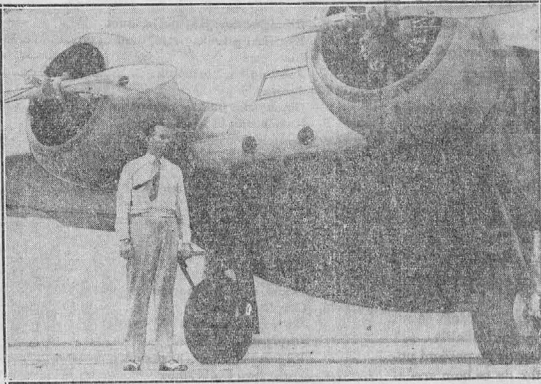
Na sliki se vidi znani letalec Clyde Pangborn, ki stoji pred svojim novim aeroplanom, s katerim namerava izvršiti polet okrog sveta in med celim potom napraviti samo tri vmesne pristanke.