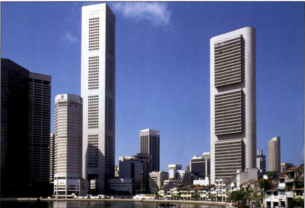
Slika 2: Mesto je eno najmodernejših na svetu, o čemer pričajo tudi številni nebotičniki.

ustanovljena samostojna država Malezija, ki je vključevala tudi Singapur. Singapur z večino kitajskega prebivalstva s takšno federacijo ni bil zadovoljen, zato je na obojestransko zadovoljstvo leta 1965 državica dobila želeno samostojnost znotraj Britanske skupnosti narodov. Po zaslugi ambicioznega vladnega programa se je, praktično brez rudnih bogastev in z veliko začetno stopnjo brezposelnosti, začel hiter gospodarski vzpon. Že konec sedemdesetih let prejšnjega stoletja je postal Singapur druga najperspektivnejša azijska država in vzoren model za dežele v razvoju. Davčne olajšave in politična ter socialna stabilnost so pritegnile številna tuja podjetja in kapital, s pomočjo katerega so nastajala nujno potrebna nova delovna mesta. Veliko so vlagali v elektronsko industrijo in tako je zaradi konkurenčnih cen ter kakovosti dela Singapur postal ena od vodilnih držav na tem področju. Vzporedno z razvojem industrije se je razvil tudi v eno od glavnih mednarodnih finančnih središč.