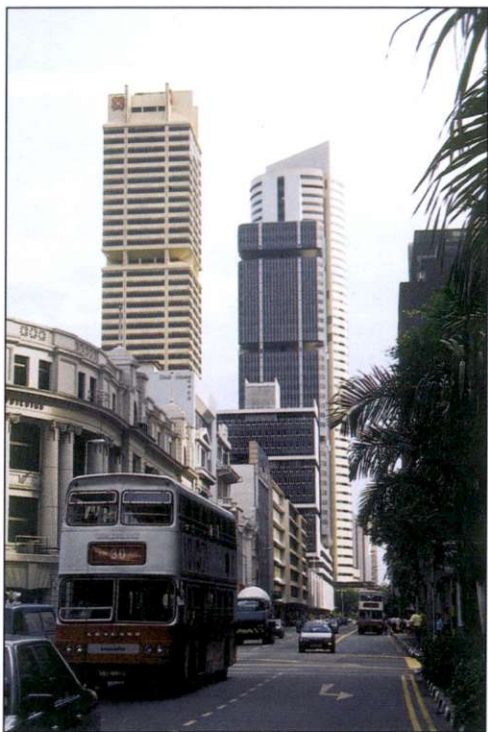
Slika 4: Poleg angleščine so rdeči nadstropni avtobusi najbolj opazna dediščina nekdanjih kolonizatorjev Angležev.

nih držav. Nedaleč je muslimanski predel s stojnicami, ki pričarajo vzdušje arabskih dežel. Najbolj zanimiva pa je stara kitajska četrt, kjer na ulicah še prevladuje utrip, značilen za južnoazijske dežele. Tipična kitajska hiša ima dve stanovanjski nadstropji, ki si ga praviloma delita vsaj dve družini. Spodnji prostor, obrnjen na ulico, je najpogosteje spremenjen v trgovino ali delavnico. Tukaj je še vedno najprimernejše prevozno sredstvo rikša, primerna tudi za nakupe na bližnjih tržnicah. Vendar so v Singapurju tudi rikše posodobljene, saj se mnoge ponašajo z glasnimi zvočniki in radiom, nekatere pa so okrašene s pisanimi lučmi, ki mimoidoče tudi ponoči vabijo na vožnjo. Stojnice in prenatrane trgovine v kitajski četrti se kitji s pisano opremo in pripomočki za kitajske templje. Tod je mogoče kupiti vse potrebno za posmrtno življenje, od papirnatega kolesa do avtomobila. Naprodaj so tudi kače, polži, ribe, žabe ... Najti je mogoče