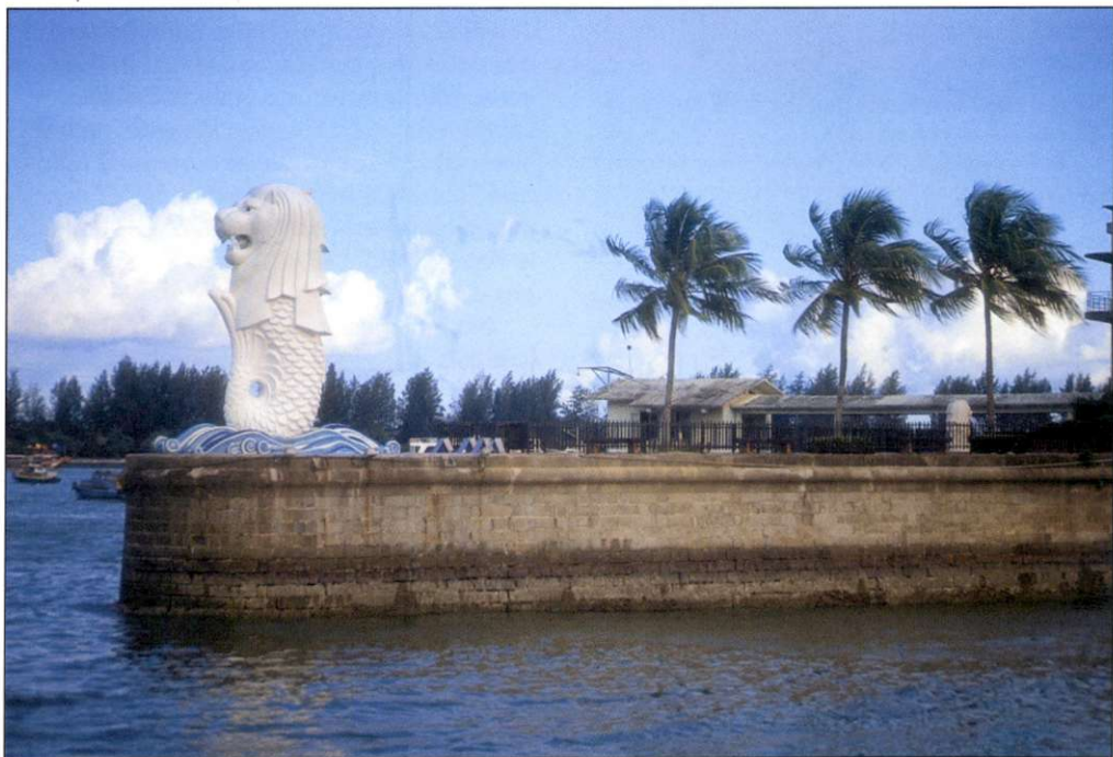
Slika 1: Lev z ribjim telesom je simbol mesta – države, čeprav levi na otoku nikoli niso živeli.

Na svojstven način se Singapurci bojujejo tudi proti pločevinasti gneči na mestnih ulicah. V času največjih prometnih konic je potrebno za vožnjo v strogem središču mesta plačati določeno pristojbino. Plačila so oproščeni le tisti, ki imajo polno zaseden avto oziroma se v njem peljejo vsaj štirje potniki. Zato so pred vstopom v mestno središče uredili nekakšna postajališča, kjer vozniki čakajo someščane, ki so namenjeni na isti konec mesta in jim zapolnijo prazne sedeže. Promet skušajo omejiti tudi z visokimi