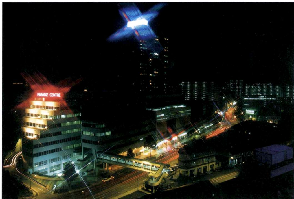
Slika 3: Singapur ponoči.

Po zaslugi vlade, ki precej strogo nadzoruje javno in tudi zasebno življenje svojih državljanov, je država postala nekakšna azijska Švica, tako po dohodkih kot po že skoraj brezhibni urejenosti glavnega mesta in okoliških spalnih naselij. Singapur je danes eno od najpomembnejših križišč v Aziji, njegovo veliko pristanišče pa velja za tretje najpomembnejše na svetu; predstavlja osrednjo oskrbovalno cono za ves jugovzhodni del azijske celine. V pristanišču vsak dan pristane več kot petdeset velikih ladij. Pristanišče je med najučinkovitejšimi na svetu, saj ima na voljo več kot osemdeset žerjavov, ki noč in dan raztovarjajo velike zabojnike z raznovrstnim blagom. Pozornost vzbujajoče je tudi veliko sodobno letališče, eno najpomembnejših letalskih križišč med Evropo, Azijo, Avstralijo in Pacifikom. Singapur se razvija tudi v pomembno telekomunikacijsko križišče, ki s svetom komunicira prek satelitov, nameščenih nad Tihim oceanom. Razmišljajo tudi o kabelski povezavi. Gospodarstvo temelji predvsem na trgovini, bančništvu, lahki in predelovalni industriji