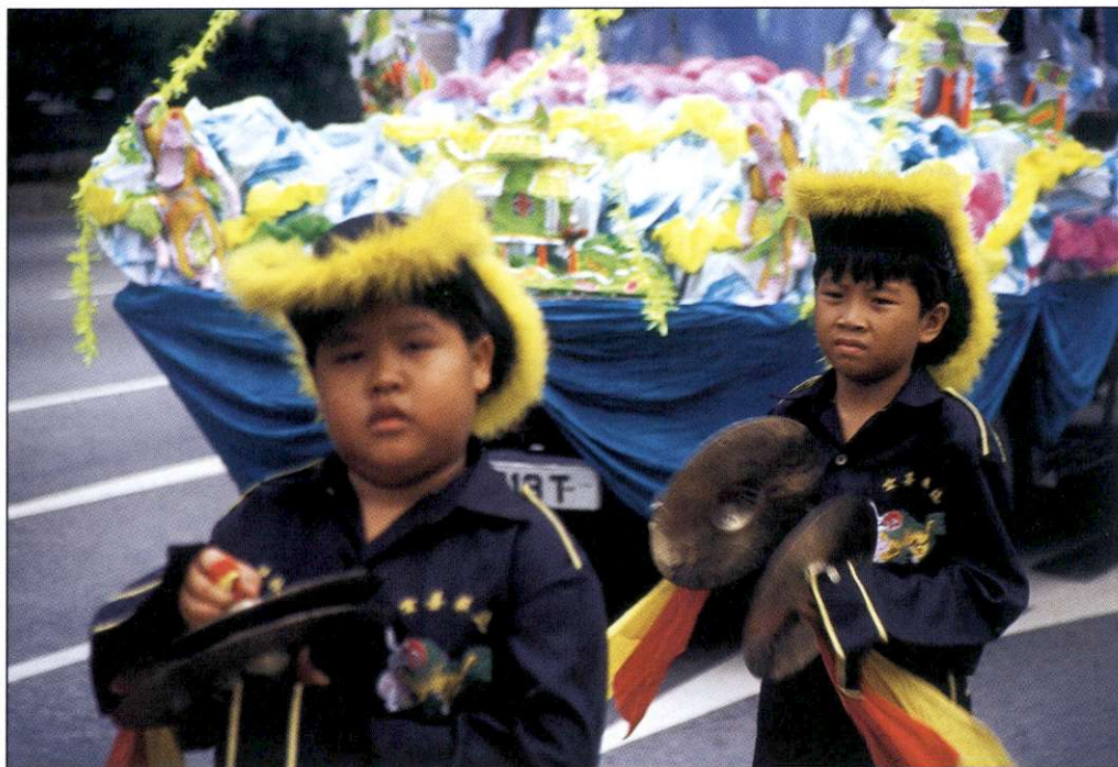
Slika 8: Na ulicah je pogosto mogoče videti razne povorke in slavlja, saj je zaradi različnih verstev skoraj vsak mesec na vrsti kakšno praznovanje.

Tradicija plesalcev s slikovitimi levjimi maskami, ki spominjajo na zmaje, je povezana z legendo. Po njej naj bi v neki ribiški vasi začeli skrivnostno izginjati ljudje. Vaški modrec je domačinom kmalu odprl oči. Za izginotja je obdolžil velikansko pošast, katere vedenje je bilo odvisno od planetarnih ciklusov. Modrec je spoznal, da se pošast boji hrupa, svetlobe in rdeče barve. Revne ribiške hiše so čez noč odeli v rdeče barve, jih razsvetlili in zraven zganjali neznošen hrup; pošast je bila premagana in v čast na ta dogodek se vsako leto organizira hrupno praznovanje luninega novega leta.