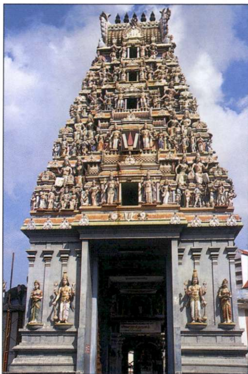
Slika 5: V državi dokaj strpno živijo pripadniki različnih narodov in verstev, o čemer pričajo tudi različni templji.