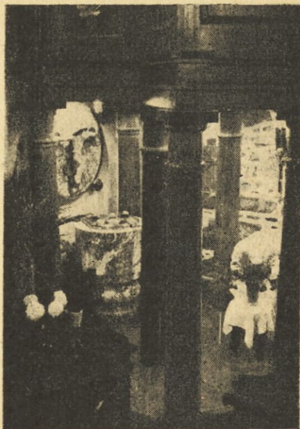
Dob, krstni kamen