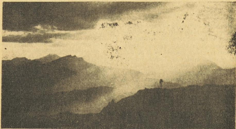
Skrivnostno lepi in hrepenenja polni so večeri na Uršlji gori