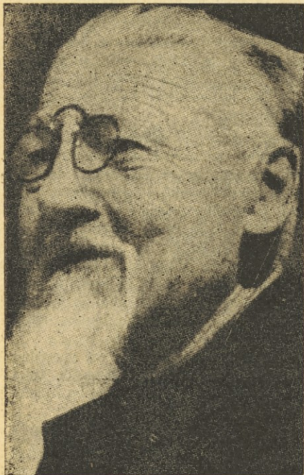
Mojster Jožef Plečnik

so dokončane. Mojster je odšel domov. Roke, ki so vse dolgo življenje neutrudno služile ustvarjanju lepote, so omahnile, oklenile se križa, napor iskanja je končan — veliki mojster je dozorel za Najvišjega mojstra.