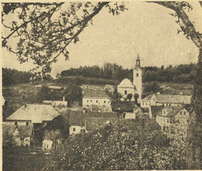
Škocjan pri Novem mestu