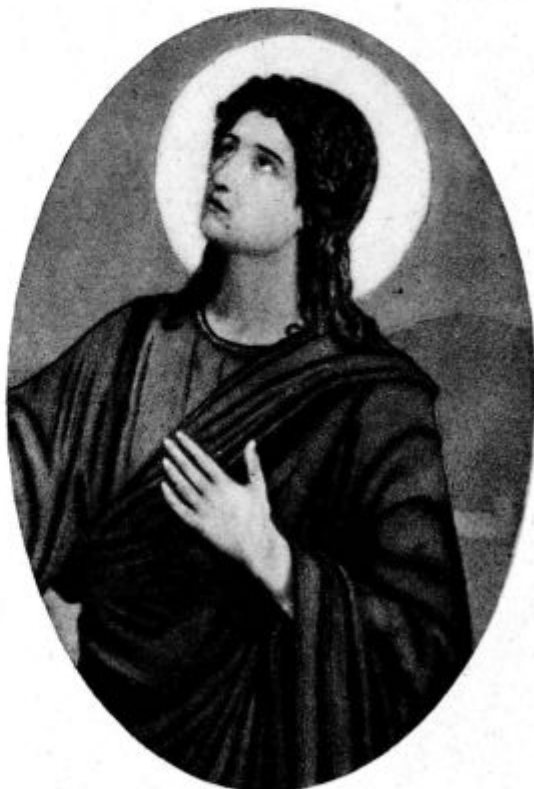
Sv. Janez Evangelist (27. decembra)

7. Katoliški škofje so proučili splošne razmere po svetu. Ugotovili so, da sporedno z zametavanjem naukov Kristusovih rastejo po svetu nasilja, krivice in zla vsake vrste. Teh žal ne morejo odstraniti niti krvave revolucije, niti nova poganska verstva, niti nobena ljudska znanost, temveč samo popolni povratek h Kristusovemu evangeliju. Zato katoliški škofje pozivajo vernike, da podvojijo svoje molitve, da bi Bog izgubljenec privedel do spoznanja prave resnice, preganjanim vrnil mir, svoji Cerkvi pa svobodo.