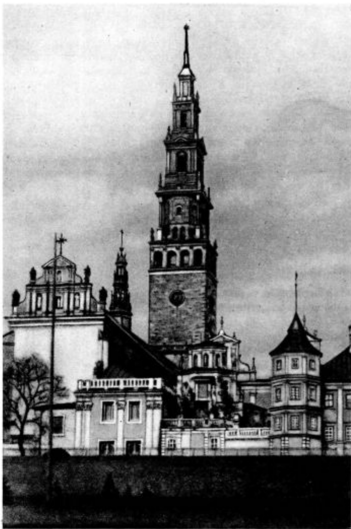
Cerkev v Čenstohovi

Kakor ukopan je poslušal Aram rezka izvajanja ognjevitęga Francoza. Slednjič pogleda kvišku, kakor da ga je kdo pretepel s šibami: