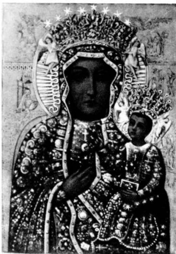
Cenostovska Mati božja