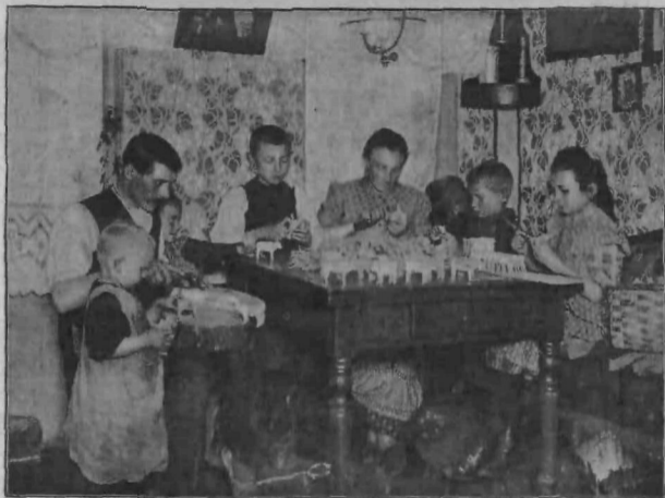
Družina, ki si kruh služi z otroškimi igračami.