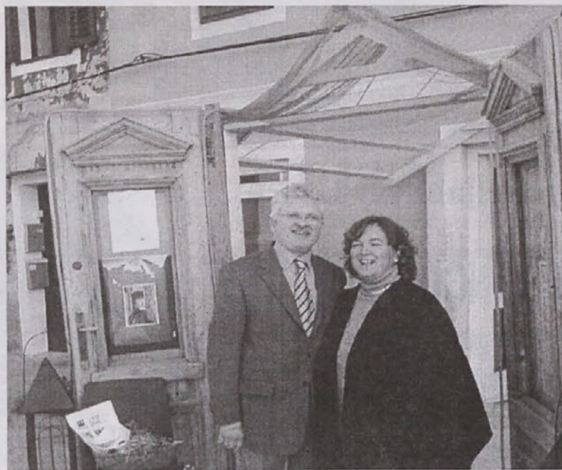
galerija ART SOCIETY Smareglieva 1, Izola Sobota, 3.decembra 2005 ob 18.uri