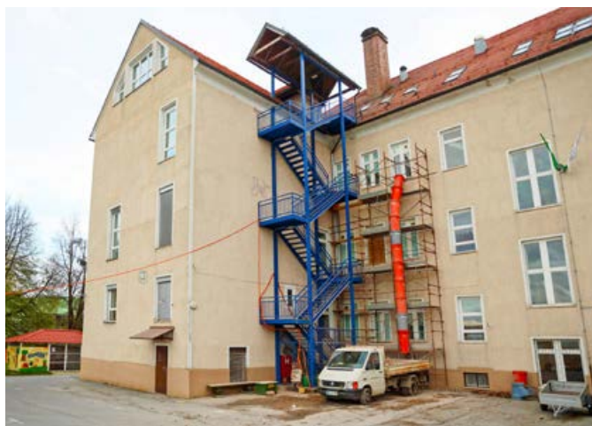
Med letošnjimi krompirjevimi počitnicami je predvidena tudi zamenjava 13 notranjih vrat.

S sklepom MS smo sprejeli, da z investicijo nadaljujemo. Druga