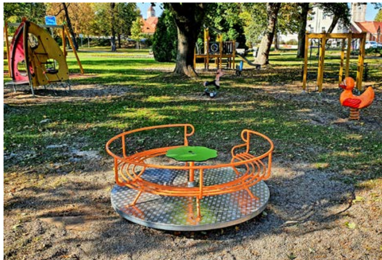
Vrtljak v mestnem parku

sredstvi. Naša želja je tudi v prihodnje mesto čim bolj ozeleniti, bodisi s trajnimi bodisi premičnimi zasaditvami.