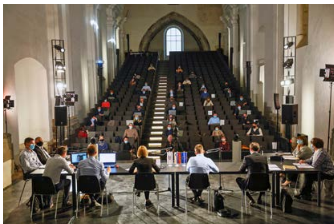
Seja Mestnega sveta je tokrat potekala v Dominikanskem samostanu.

Nadalje so svetniki sprejeli predlog Odloka o proračunu Mestne občine Ptuj za leto 2021, ki je določen v višini 35,9 milijona evrov, in ga posredovali v 30-dnevno javno razpravo. Večje in-