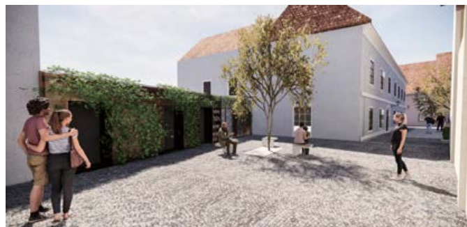
Vizualizacija Vrazovega trga

Cilj projekta je ureditev javnih površin, ulic in Vrazovega trga, zamenjava gospodarske javne infrastrukture (vodovod, kanalizacija) ter prenova in novogradnja kulturno-umetniškega središča Stara steklarska. Z obema posegoma bomo obnovili in oživel večplastno urbano in arhitekturno dediščino. Obnova Stare steklarske bo revitalizirala del mestnega jedra in njegovo aktivno vlogo v življenju mesta. Cilj obnove je vzpostaviti trajno in učinkovito infrastrukturo za ljubiteljsko (v najširšem pomenu) umetniško in kulturno ustvarjanje.