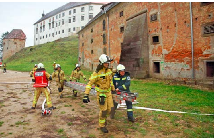
Redne vaje in usposabljanje so pomembne za uspešno delo.