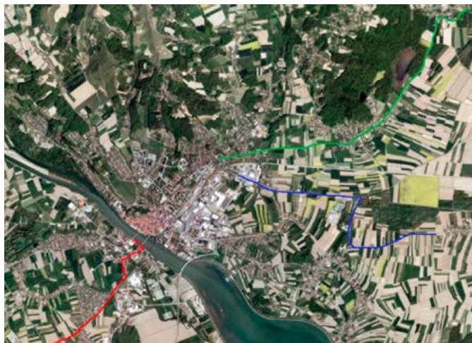
Trasa kolesarskih povezav za odseke 1, 2, 3

Zaradi podražitve projekta in pomanjkanja evropskih sredstev je Mestna občina Ptuj morala sprejeti odločitev, da k izvedbi odseka 4 ne bo pristopila. S tem so se sofinancerska sredstva iz tega odseka prerazporedila na preostale odseke, lastna sredstva sodelujočih občin pa so se posledično zmanjšala.