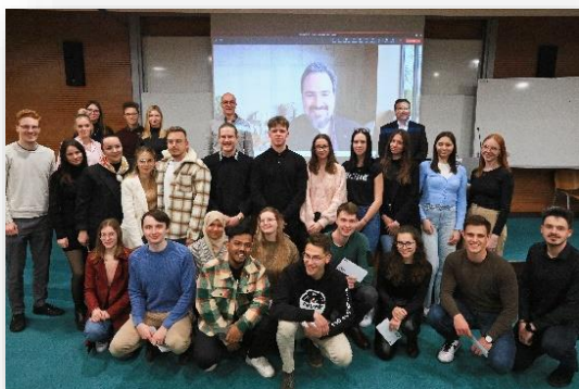
Video utrinek dogodka

MediaMagnet Hackathon so zaznamovali sodelovanje, inovacije in kreativnost. Dogodka se je udeležilo 58 študentov v 10 ekipah, ki so reševali kompleksni poslovni izziv medijskega podjetja VEČER. Po 6 urah so ekipe predstavile inovativne rešitve. Direktor VEČERa je povabil pet zmagovalnih ekip na obisk v podjetje za podrobnejšo razpravo o idejah.